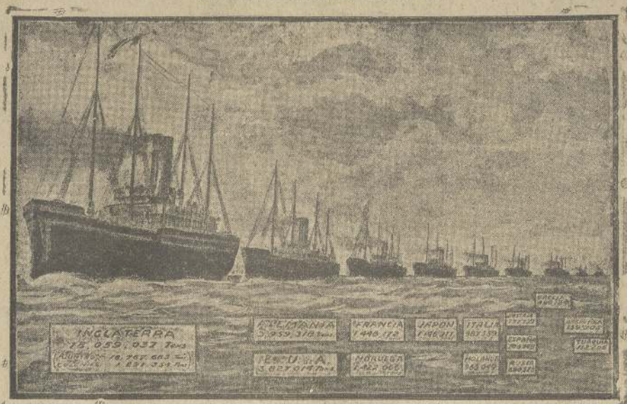
Los vapores de los países representados en el Tribunal Internacional de Presas

Las disposiciones contenidas en la «Declaración de Londres» y la forma en que están expresadas han suscitado en la opinión y en la prensa inglesa una viva polémica que se traduce, como cada asunto inglés, en tema de política.