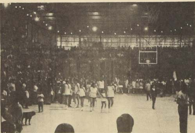
VISTA PARCIAL del nuevo Gimnasio techado de La Calera cuando recién se iniciaba en él su primera competencia.