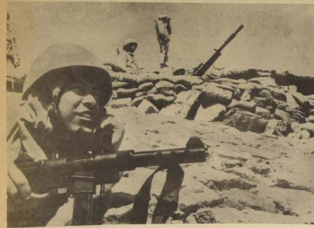
EN ALGUN LUGAR DE EGIPTO. — Durante las recientes maniobras, un sistema de unidad aérea atrincherada informó a través de la vía telefónica. Mientras tanto, en Tel Aviv, el Secretario de Estado de USA, Rogers realizó variadas conversaciones con los líderes del Gobierno, en una gira que efectúa por Israel vía Sinal.