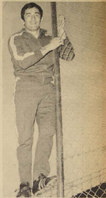
VERON: En lo alto de la fama y valor indispensable en el ataque del campeón del mundo.