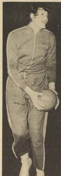
Uliana Semenova, la basquetbolista soviética más alta del mundo.

Día 23: Descanso. Día 24: URSS versus Checoslovaquia. Brasil versus Japón. Día 25: Cuba versus Francia. Japón versus Checoslovaquia. Día 26: Francia versus Checoslovaquia. Brasil versus Cuba. Día 27: Cuba versus Corea del Sur. Brasil versus Checoslovaquia. Día 28: Descanso. Día 29: Japón versus Cuba. Brasil versus URSS.