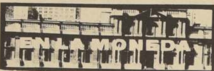
Día Nacional del Trabajo Voluntario.