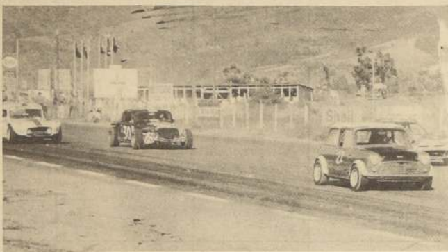
Los coches se agrupan para largar. Esta escena volverá a repetirse este fin de semana.

—Bueno, que puede correrse a un promedio de 220 km/h y ya estaría batido el récord. Ahora ponerle un nombre, todos son buenos y cualquiera puede batirlo".