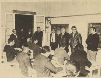
24 TRABAJADORES de la Central de Quetehues, de la Compañía Chilena de Electricidad, CHILECTRA, están terminando sus estudios básicos en la Escuela Fiscal, que allí funciona, con las desinteresadas colaboraciones del profesorado. Recientemente el Presidente Allende envió, por escrito una calurosa felicitación a los trabajadores de CHILECTRA por sus esfuerzos extraordinarios en pro de la mejor producción de energía eléctrica para el país. En la foto, un aspecto del mencionado curso de estudios básicos, en la Central de Quetehues, aparecen también algunos dirigentes sindicales que estuvieron de visita en el establecimiento.

10.- Vigilar el ausentismo injustificado, impulsando y creando la responsabilidad y disciplina en el trabajo.