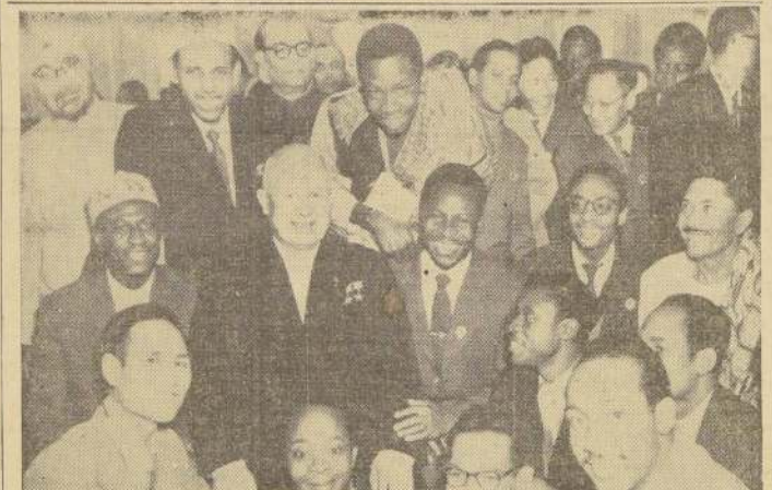
"N. K." Y LOS ESCRITORES AFROASIATICOS.—Vemos aquí a Nikita Khrushchev en medio de los escritores afroasiáticos, que se reunieron en el Kremlin con ocasión de un congreso realizado allí recientemente.

llegar la noticia de que la mujer había dado a luz tres varoncitos. —UN AROGADO americano recibe carta de uno de sus clientes condenado a la silla eléctrica y que le pide un último consejo. El abogado le telegrafía inmediatamente: "No se sienta bajo ningún pretexto". —DURANTE años y años me pesé todos los días en una de esas básculas que lanzan una tarjetita con la cantidad de kilos que uno pesa. Recuerdo que cuando empecé a hacer eso pesaba setenta kilos. Ahora peso noventa y cinco. —¿Qué bien! ¿Y cómo hiciste para aumentar tanto? —Es que ahora tengo los bolsillos repletos de tarjetitas. —ABRAHAM le debe una gran suma de dinero a Levy. Un día se encuentran en la calle. Levy aprovecha la ocasión y pregunta: —¿Cuándo me vas a pagar, Abraham? —¿Cuándo me vas a pagar? Cuando me vas a pagar? Siempre estás con lo mismo. ¿Pero te has creído que yo soy profeta? —UN DIARIO de Albany, Estado de Nueva York, publicaba el siguiente aviso: "Inadaptado, perezoso, ignorante, irresponsable, sin experiencia, sin capacidad y sin referencias, necesita ocupación remunerativa que no dé mucho trabajo".