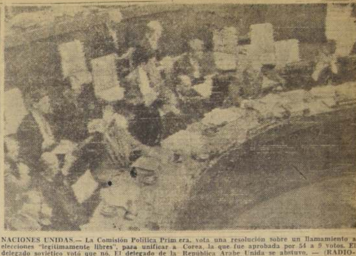
NACIONES UNIDAS. — La Comisión Política Primera, vota una resolución sobre un llamamiento a elecciones "legítimamente libres", para unificar a Corea, la que fue aprobada por 54 a 9 votos. El delegado soviético votó que no. El delegado de la República Árabe Unida se abstuvo.