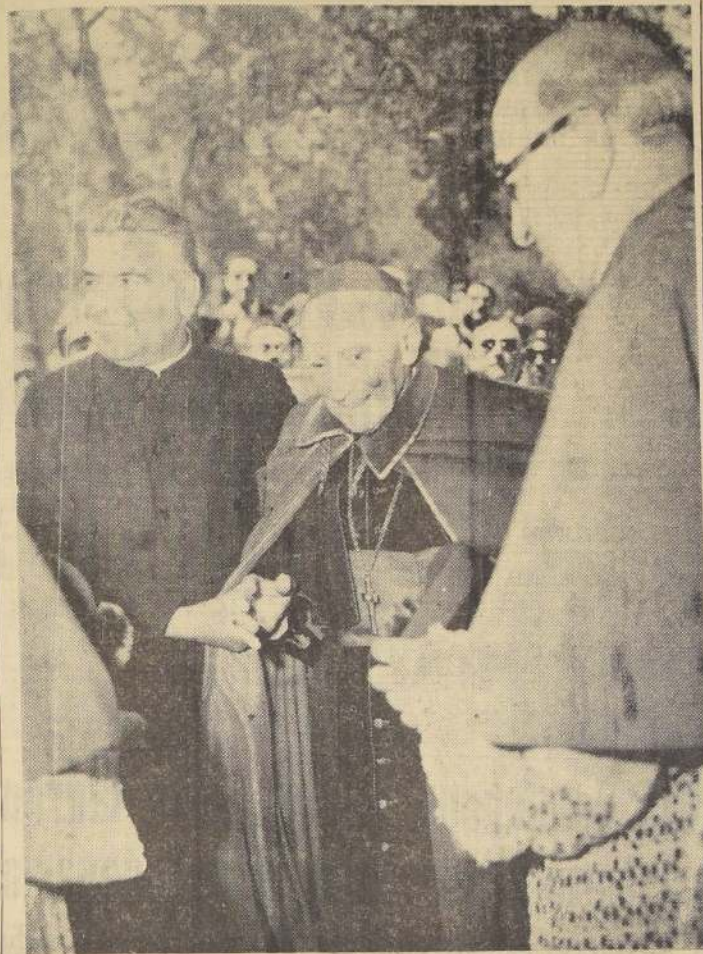
LLEGADA A LA CATEDRAL. — A su llegada a la puerta de la Iglesia Catedral, Su Eminencia recibe el saludo de los miembros del Venerable Cabildo Metropolitano, momentos antes de iniciarse los oficios del solemne Te Deum de Acción de Gracias. Los alrededores del templo estaban cubiertos por una multitud de varios miles de fieles que vivieron insistentemente al Cardenal y otro grupo también muy numeroso, siguió con devoción en el interior el desarrollo de la ceremonia.

COOKE DIRIGIO GOLPE CONTRA EL PRESIDENTE FRONDISI