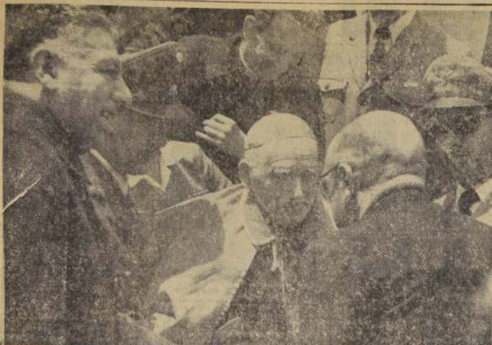
"GRACIAS A DIOS, MUY BIEN". — Cómo llegó Su Eminencia? "Gracias a Dios, muy bien". Este diálogo se repitió ayer muchas veces en la sala del aeropuerto de Los Cerrillos.