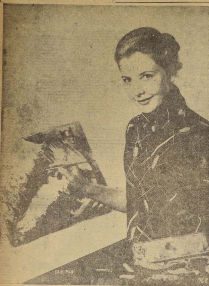
JUNE THORBURN, una de las excelentes actrices de la pantalla británica.