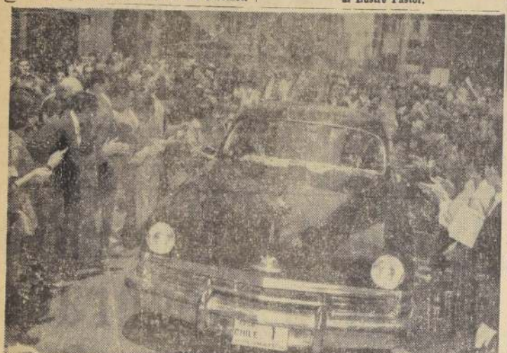
ESPONTANEO HOMENAJE POPULAR. — El gráfico es elocuente muestra del espontáneo homenaje popular que recibió el Cardenal Caro, no sólo en el puerto aéreo de Los Cerrillos.