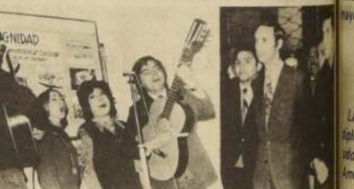
En el Día de la Dignidad, los trabajadores del Ministerio de Educación celebraron la Nacionalización del Cobre en un acto en que participaron los grupos artísticos como el Conjunto Lonqui.

Tenemos la seguridad de que este compromiso se beneficiará en los plazos previstos. Los datos por permitirnos apoyar esta realidad, y participar en el primer cumpleaños de nuestra patria libre, independiente socialista", dijo finalmente el Ministro de la Vivienda y Urbanismo, Luis Matte.