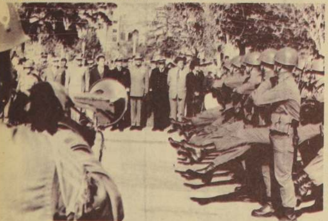
CEREMONIA cívico-militar efectuada en la Plaza O'Higgins de Valparaíso con motivo del Juramento a la Bandera, en que 420 conscriptos prestaron el tradicional juramento y en que pronunció una alocución