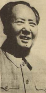
Mao Tse Tung