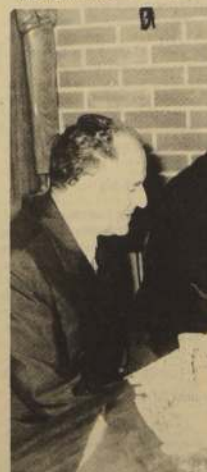
El mundo actual no es el de los tiempos de Marx.

—No obstante, y a pesar de todo, la lucha por la autogestión