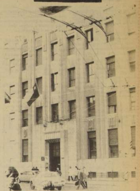
EDIFICIO EN QUE FUNCIONA, el Departamento de Accidentes del Trabajo y Enfermedades Profesionales, del Servicio de Seguro Social.