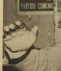
Y canté tangos.

La entrevista con el amigo de la infancia, hombre de radio y teatro termina dentro de muchos