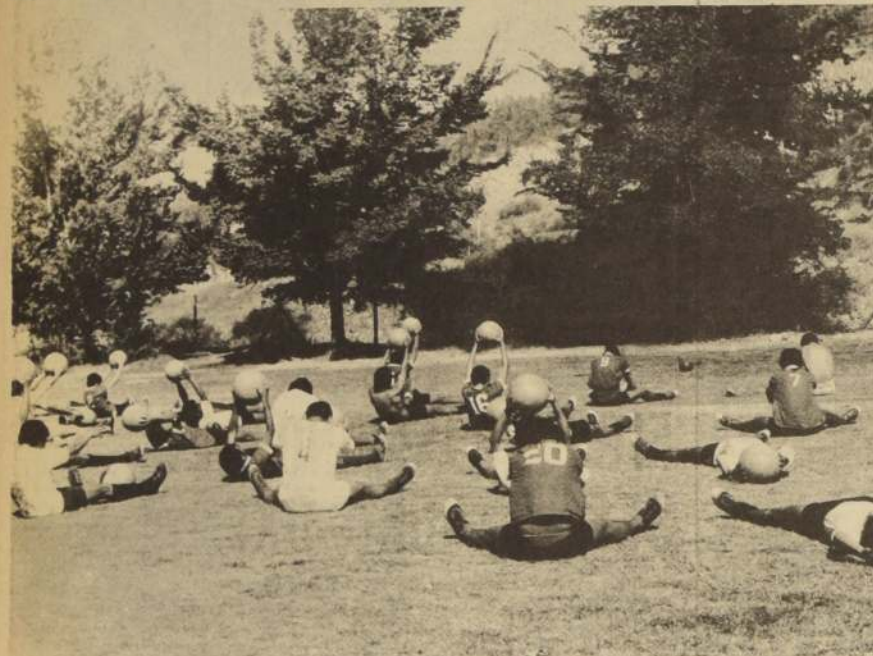
En el Estadio Santa Rosa de las Condes, Universidad Católica planea su triunfo ante O'Higgins.