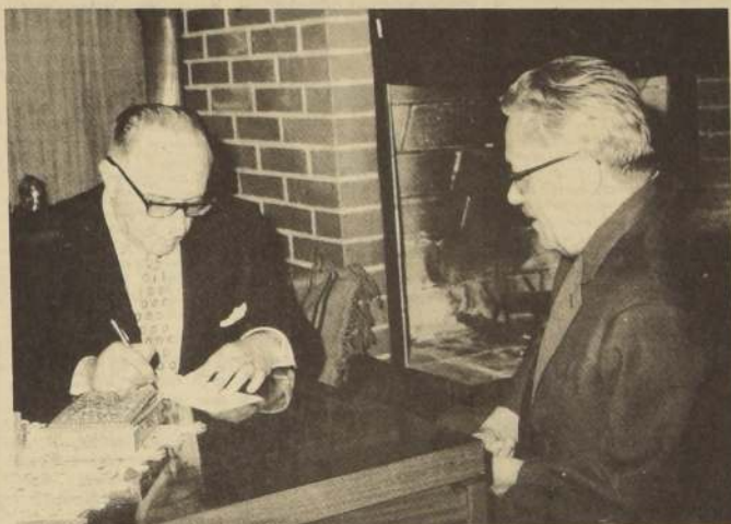
La autogestión comienza allí, donde termina la propiedad capitalista privada.

Entrevista hecha por nuestro director, en Belgrado, que se publica hoy simultáneamente en "LA NACION" de Santiago, en la prensa de Belgrado y en el resto del mundo, transmitida por la agencia española EFE.