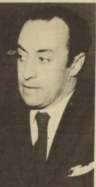
Ministro de la Vivienda y Urbanismo, Luis Matte.

"El MINVU, a través de sus Corporaciones y de la Caja