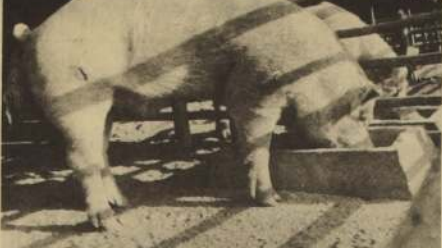
EL SERVICIO AGRICOLA y Ganadero dará asistencia técnica para el completo e importante plan porcino.

Los trabajadores apoyaron con entusiasmo, a través de ovaciones, las informaciones que recibieron sobre la estatización de GASCO, aun cuando grupos minoritarios pidieron plebiscito. Varios dirigentes de los trabajadores usaron de la palabra y destacaron principalmente que el área social les concede mayor participación, administración y en la fijación de las metas de las industrias que integrarán el área social.