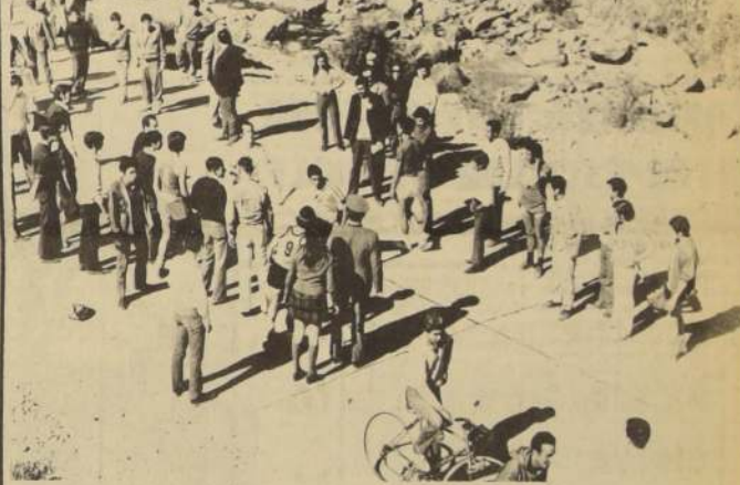
POSTA "Correo del Cobre", evento atlético que atrae a los habitantes de Chuqui, se corre el domingo.

La entrega de premios se efectuará el mismo día, en la tarde, en el Club Obrero y consiste en valiosos trofeos conmemorativos a tan significativa fecha.