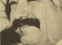
Los niños, también en su trabajo de veinticinco años

Aquí no duré mucho, y prefería incursionar en los radioteatros que me dieron la oportunidad de salir a los teatros de barrio. Yo quería actuar y no ser alumno de