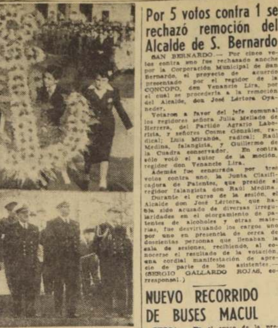
pereros estudiantes que se congrega- compañeros de gloria.— Durante el