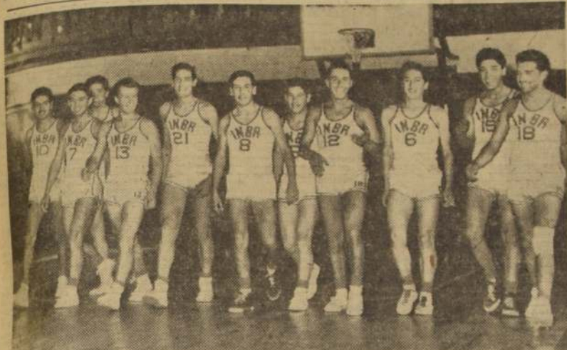
"CLASICO" ESCOLAR. Hubo ayer en fútbol y básquetbol entre los conjuntos del Instituto Nacional y Barrios Arana, quien se encuentra en plena celebración de su 53.º aniversario.