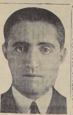
Don Juan Antonio Ríos