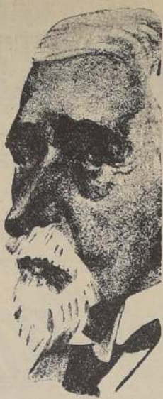
Don Alfonso Carlos de Borbón, por cuya exaltación al trono luchaban los carlistas

La capital, en el entretanto, se halla completamente desprotegida de la cercanía de los rebeldes.