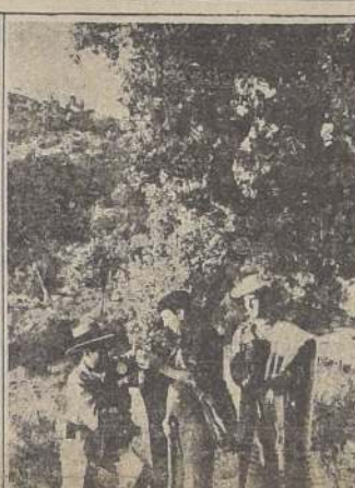
El jefe de la columna de milicianos de Villanueva de Córdoba imparte instrucciones a su gente