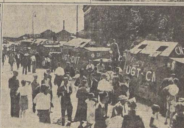
Carros blindados llegan a Madrid procedentes de Cataluña