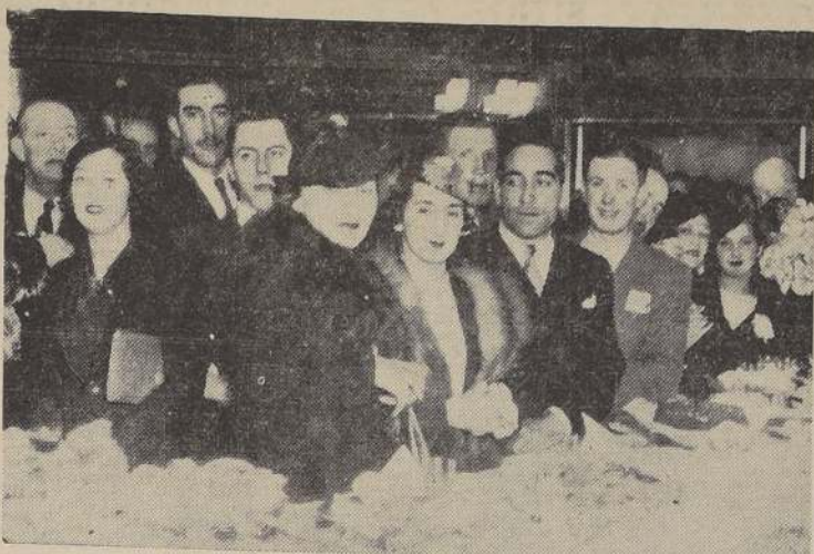
Parte de los asistentes a la reunión social a que dió lugar ayer la inauguración del Hotel Ritz.