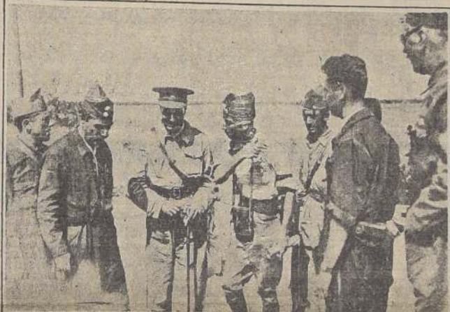
El general Azaña recibe noticias de la marcha de las operaciones