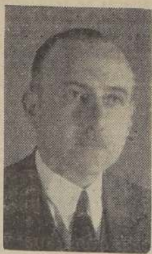
El Alcalde de Rancagua, don Francisco Cantón

Uds. ven que dentro de una poquísima máxima la Municipalidad ha llevado el progreso y el bienestar a donde ha podido, contando con la cooperación de una mayoría francamente favorable.