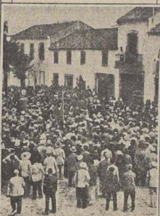
Los vecinos de Alcanacejo se presentan en la comandancia militar para alistarse