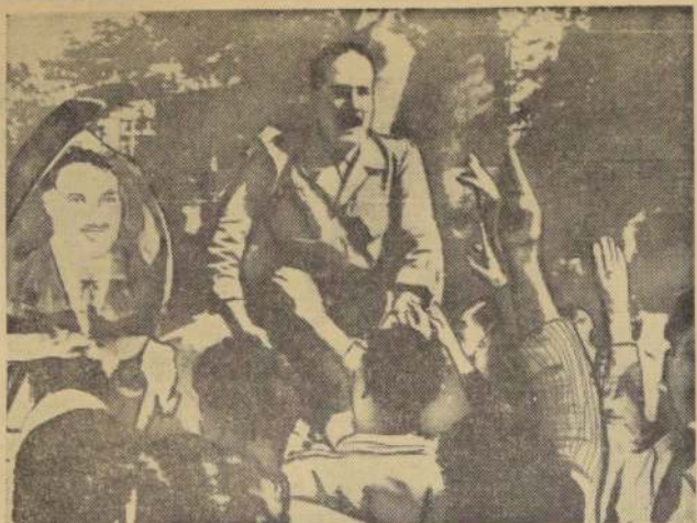
DAMASCO.— Un sargento de las Fuerzas Armadas sirias que se rebelaron contra el Presidente de la RAU, Gamal Abdel Nasser, es conducido en hombros por la multitud.