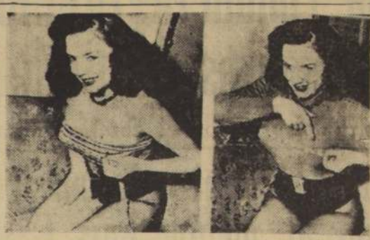
REFUERZOS DEL GOBIERNO. — El Gobierno, sin embargo, continuó enviando refuerzos a la Cochinchina Occidental.