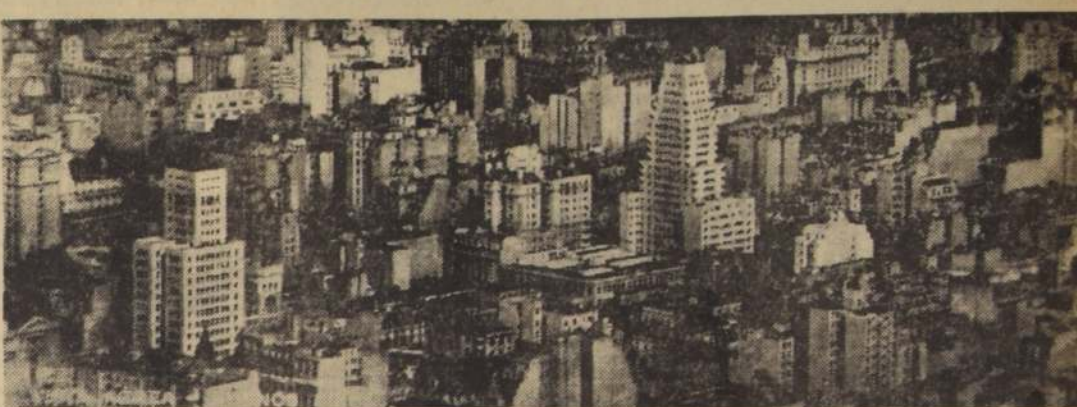
Buenos Aires, capital argentina, se viste hoy de fiesta, para celebrar el nacimiento del gran pueblo hermano a la vida independiente.

A través del territorio nacional, las 6 universidades argentinas son focos del saber, y preparan en sus aulas decenas de miles de estudiantes, que año tras año engrasan las filas de quienes laboran por la grandeza de su patria, desde la antigua Universidad de Córdoba, "la Docta", hasta la novel Universidad de Cuyo. Pródigo en bellezas naturales, el territorio argentino se extien-