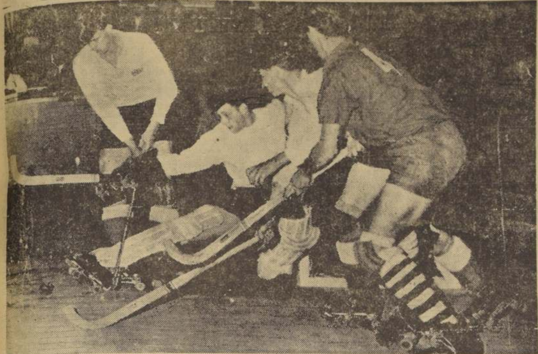
CHILE-G. BRETANA. — MILAN, Italia. — El jugador chileno, no identificado (con camiseta oscura) moviliza a la defensa del equipo de Gran Bretaña durante el campeonato mundial de Hockey en patines realizado en Milán. Los chilenos vencieron a los ingleses por 2 a 1.