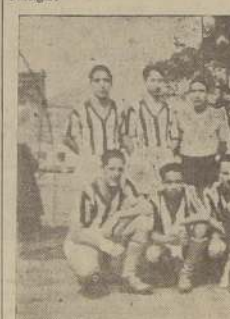
Equipo de División Especial del Club Beltrán Ilharrebord e e Hijo, que ha tenido un brillante desempeño en la última temporada.