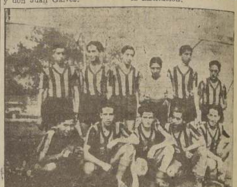
Equipo Juvenil del Club Beltrán Ilharrebord e e Hijo.

Aparte de los numerosos partidos en que ha intervenido el club, y que le han valido el adjudicarse las Copas Iberia, Juan Pagola y otros trofeos, la institución realiza— con el apoyo económico de la firma— interesantes festivales deportivos para el día de los miembros honorarios, para el 5 de abril y en otras fechas, en que se pone siempre de manifiesto el espíritu de camaradería que reina en la institución.