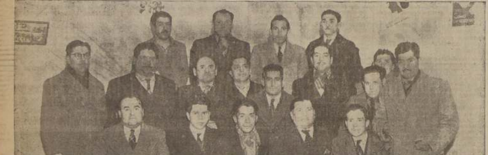
Dirigentes y delegados de la Liga Eléctrica de Deportes y del Sindicato Industrial de la Cia. Chilena de Electricidad Ltda.

La Liga Obrera de Deportes y el Club de los Empleados son instituciones que cuentan con varios cientos de afiliados.— La Empresa apoya decididamente las iniciativas deportivas de su personal