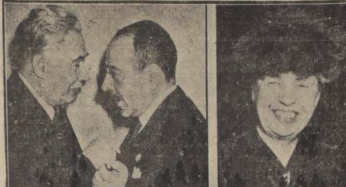
Dimitri Manuiski, representante de Ucrania, charla amistosamente con el Ministro de Relaciones de Grecia, Juan A. Sophianopoulos, poco antes de que éste regresara a Atenas. — La señora Eleanor Roosevelt fotografía da en Londres cuando se disponía a partir a Alemania, país donde hoy se encuentra visitando a las fuerzas americanas de ocupación.