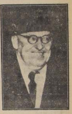
Andrei Vishinsky, representante de Rusia en la ONU

Agregó: "Nos parece difícil entender que la evacuación de tropas extranjeras requiera un plan detallado".