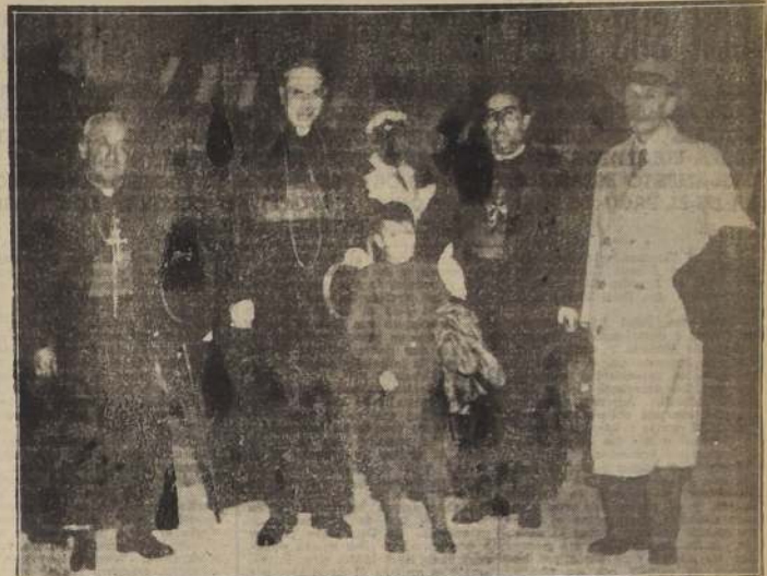
El Nuncio Apostólico y los Arzobispos de Ayacucho y Concepción, que regresaron ayer de Punta Arenas en el avión Lockheed "Electra", en tiempo récord.