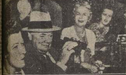
Churchill en compañía de su esposa presencia unas carreras en un hipódromo de Florida.