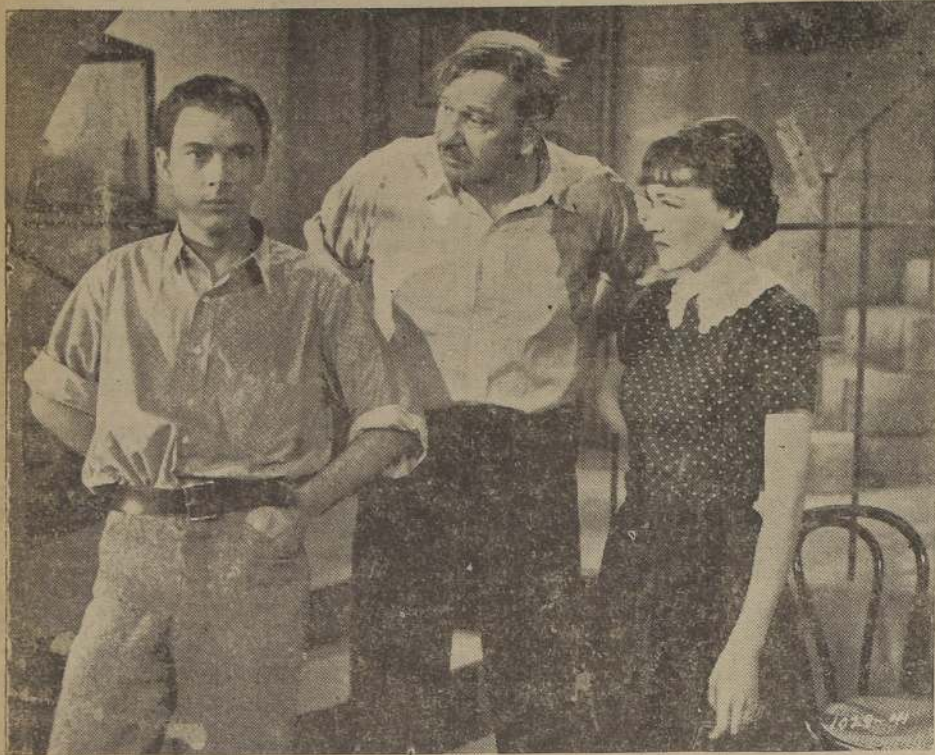
Wallace Beery, Maureen O'Sullivan y John Beal en una escena de la película "La mujer comprada", que sirvió de base para organizar este simpático concurso. "La mujer comprada" se exhibe actualmente en el Teatro Metro.

Un éxito formidable! — Se recibieron varios miles de soluciones que demuestran las simpatías que despierta este gran actor de los elencos de la Metro Goldwyn Mayer. — "Grand Hotel", "Cena a las ocho", "Alma brava" y "El borrachín", eran los títulos que correspondían a las cinco escenas. — La lista de los premiados