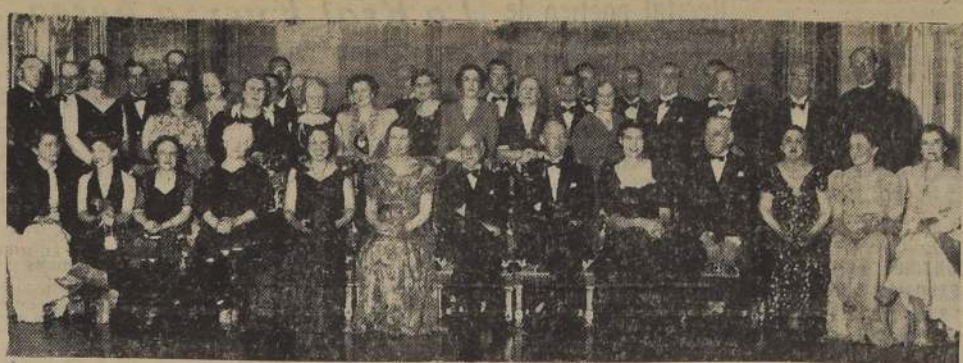
Asistentes a la comida ofrecida antenoche en el Club de la Unión por el Consejero de la Embajada de Estados Unidos y señora de Frost en honor del Embajador de Gran Bretaña y Lady Bentinck, con motivo de su próxima partida.

Por inconvenientes de última hora, se ha postergado, para el lunes 16, la comida de los jefes y oficiales de la Fuerza Aérea de Chile, que se efectuará en el Club Militar.