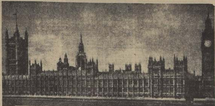
El Parlamento británico

Bomba incendiaria en la Cámara de los Lores