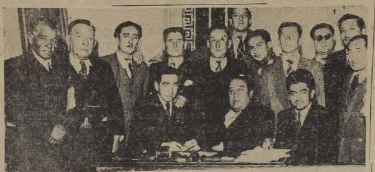
Dirigentes del Congreso Obrero Radical

A las 14.30 horas de hoy, tendrá lugar en la Casa del Partido Radical, ubicada en calle Huérfanos 1310, la solemne inauguración del Primer Congreso Provincial de Obreros Radicales. Esta concentración de obreros del radicalismo tiene por objeto ofrecer a los propios participantes y a los miles de trabajadores radicales a quienes ellos representan, la oportunidad de estudiar sus problemas bajo los auspicios del Partido y de acuerdo con los principios, doctrinas y programas que inspiran su acción colectiva.