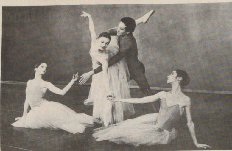
Una novedosa iluminación, sobre un telón de fondo importado desde Alemania, se estrenará en la función del ballet "Serenade" el 17 en el Teatro Municipal.

Lesionado asistió ayer a ultimar detalles del nuevo telón que el Teatro importó desde Alemania y estrenará el 17 en la función de ballet