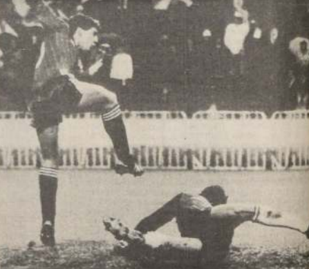
El delantero escocés, Eric Black, derrota la culla del fútbol español por 2 a 1, en la final de la Copa Europea.

Verona enfrentará a Sampdoria, Fiorentina a Pisa, y Udinese a Lazio en otros partidos de la trigésima y última fecha del campeonato.