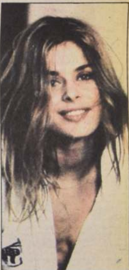
Nastassja Kinski cautivó a la crítica por su belleza y talento.