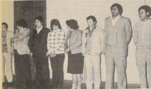
El grupo fue sorprendido en los instantes que ofrecía y compraba dólares en la esquina de Agustina y Ahumada. Operaban por encargo de un financista cuyo nombre no fue revelado. Ayer fueron entregados a la justicia ordinaria.