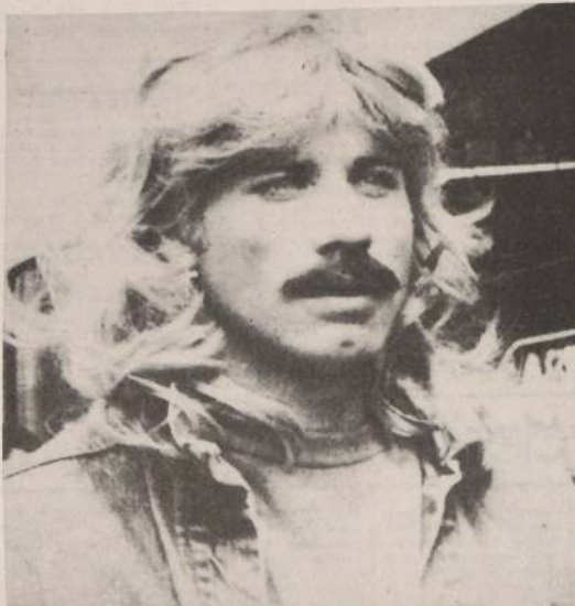
¿QUIEN ES ESTE PERSONAJE? Irreconocible aparece el actor John Travolta, quien camina por una calle del West Side de Nueva York disfrazado con una peluca rubia. Este atuendo pertenece a una escena de la película "Second Chance", que se filma en la mencionada ciudad.

Finalmente, el viernes 20 de mayo, la clausura de esta cruzada se realizará en el Teatro Casino Las Vegas.