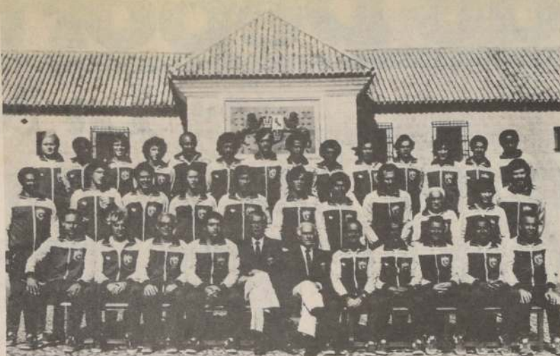
Este fue el plantel completo que Brasil trabajó para el Mundial de España en 1982. Ahora con un nuevo entrenador, con rostros conocidos y de los otros, el conjunto brasileño debe reconquistar el título, esa es su meta.

La primera jornada contó con la concurrencia de casi 300 competidores, provenientes de 30 establecimientos escolares en el circuito que comprende las calles Comercio, Avenida Central, Castelar Norte, Avenida Las Industrias y Comercio. Para la segunda etapa a disputarse hoy se presume que serán más de 400 los anotados, debiéndose realizar series para todas las categorías en damas y varones y diversos tipos de bicicletas, esto debido a la enorme afluencia de niños de todos los sectores del Gran Santiago que pugnan por competir.