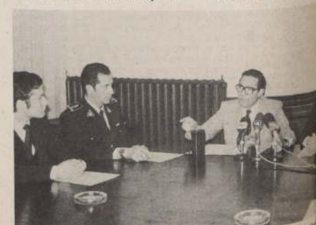
El Ministro de Justicia, Jaime del Valle, durante la constitución del Consejo Superior de Gendarmería.

El Ministro del Valle, quien aprobó totalmente el proyecto, dijo que trabajaron diversos especialistas, analizando las necesidades docentes, analizando las necesidades de seguridad, de rehabilitación, de administración, de educación física y de estudios sociales.