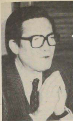
Ministro de Justicia, Jaime del Valle.

La autoridad en cumplimiento de un deber constitucional ha de prevenir la repetición de estos actos, por lo tanto, obrando en consecuencia, ha hecho y hará el más enérgico uso de todas las facultades legales procedentes, sin perjuicio de las posibles acciones a entablar ante los Tribunales de Justicia, por infracción a la Ley de Seguridad del Estado.