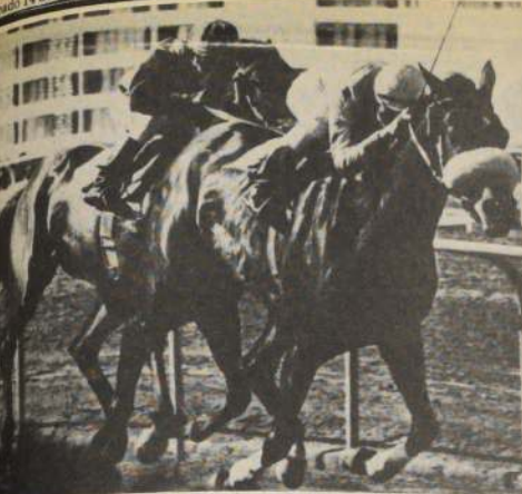
VISITADORA: tendrá a una hermana materna debutando en la reunión del Club Hípico de Santiago. La potranca de dos años se llama "ROTARY STAR" y es hija de Royal Aura y Gitanesca.

Santiago de Chile, Sábado 14 de Mayo de 1983