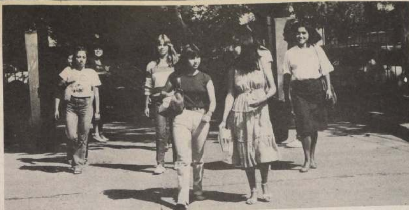
El porcentaje de mujeres en las aulas universitarias tiende a subir cada año.

El diplomático concluyó sus palabras resaltando que las distinciones entregadas son un testimonio de la amistad recíproca.