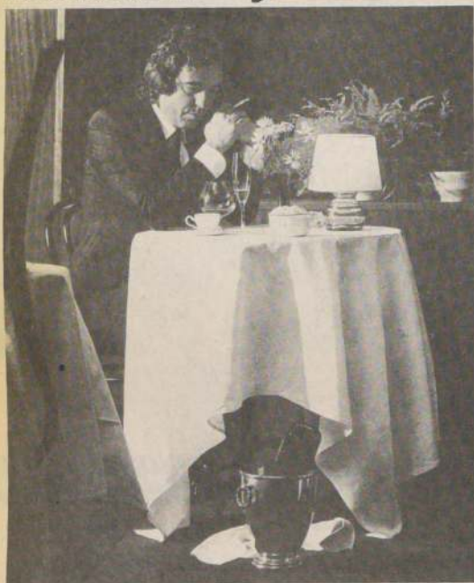
Dyango considera que su último elepé "Bienvenido al club" es el mejor logrado de su carrera.