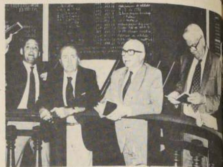
Participación de instrumentos de renta fija en mercado bursátil aumentó a 62,7% en abril.

Por último, los exportadores del rubro señalaron la necesidad de contar con un seguro para las exportaciones, lo que les permitirá cubrir el riesgo para el pago de los productos en la nación importadora, asegurando así el retorno de las divisas.