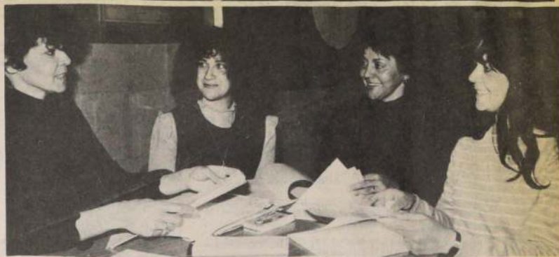
Un movimiento australiano de feministas negras —bajo la bandera de la Federación de Mujeres Aborígenes— espera tener a toda mujer aborígena australiana en sus filas en un movimiento nacional que pretende que las mujeres aborígenes tengan más que decir en los asuntos aborígenes.

Han estado al frente de todos los asuntos que afectan el bienestar de los aborígenes, un reflejo y extensión de su papel tradicional de protectoras de la unión familiar.