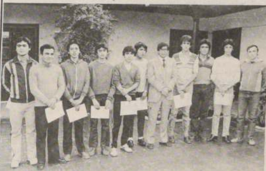
ALCALDE ALVAREZ CON CICLISTAS

Una invitación a la municipalidad, a los integrantes de los dos equipos que participan en el primer circuito ciclistico de la Región Metropolitana, hizo el alcalde de Conchalí Luis Fernando Alvarez. En la oportunidad, y ante todos los funcionarios de la corporación edilicia, le entregó un diploma de honor, testimoniando la satisfacción por la labor cumplida. El alcalde lo felicitó exhortándolo a seguir participando en futuras competencias ciclistas en defensa de los colores de Conchalí. En la foto 1, el alcalde junto a los dos equipos de ciclismo. Foto 2: el jefe comunal hace entrega de un diploma de honor al director técnico del equipo de corredores.