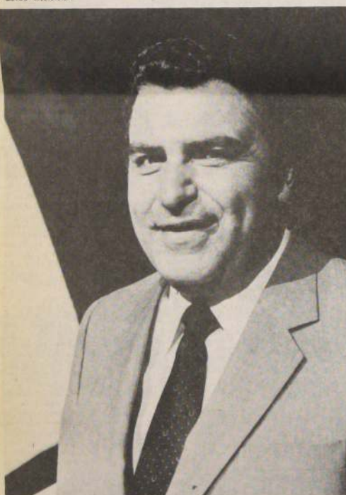
Mario Kreutzberger, hoy en "Sábados Gigantes".