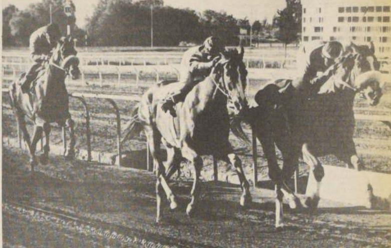
MAC LAREN: se ha visto muy bien en los cotejos palmeños. El velocista movió los 500 metros en 31 segundos.

1.200 metros CONDENADO C. González en 1:18. NO SMOKING J. Castillo y MOLINOS Suárez en 1:17 1/5 iguales.