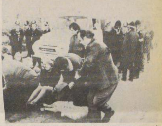
GREENHAM COMMON, Inglaterra. — Manifestantes son sacadas de un "campamento de paz" en las afueras de una base de la Fuerza Aérea de Estados Unidos, donde se van a instalar proyectiles nucleares. (Radiofotografía AP).

Previamente, expertos presupuestarios del Mercado Común dijeron que la única fórmula capaz de superar el déficit de efectivo vaticinado para 1984 sería la aplicación de drásticas reducciones o un brusco incremento de los ingresos.