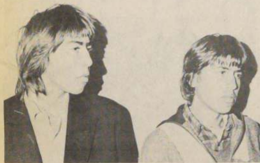
Asesinaron a cuchilladas a un compañero de juegas que tuvo la mala idea de robarles una bolsa con neopren y una radio a pila. Ambas fueron reclusos en la Cárcel Pública.

Ambos criminales, fueron entregados al magistrado del Cuarto Juzgado del Crimen de la capital, quien ordenó su encierro en el Centro de Detención Preventiva, ex Cárcel Pública.