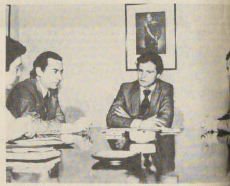
Alrededor de cien empresas del rubro metalmeccánico estarán representadas en la primera misión empresarial de esta actividad, que viajará hoy a Estados Unidos.

Añadió que "esta medida — si se analiza — ha provocado un flujo de las ventas y si se estudia cuáles han sido los mayores aumentos, vemos que son los medianos y chicos los que más han aumentado".