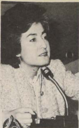
Ministra de Educación, Mónica Madariaga.

"También, señaló finalmente, me comprometeré dedicarme a la parte político-sindical, de tal forma que me encontraré con todos esos amigos que andan deambulando como turistas por el mundo y que deben pasarlo muy bien, porque hoy día ser activista sindical es una muy buena profesión".