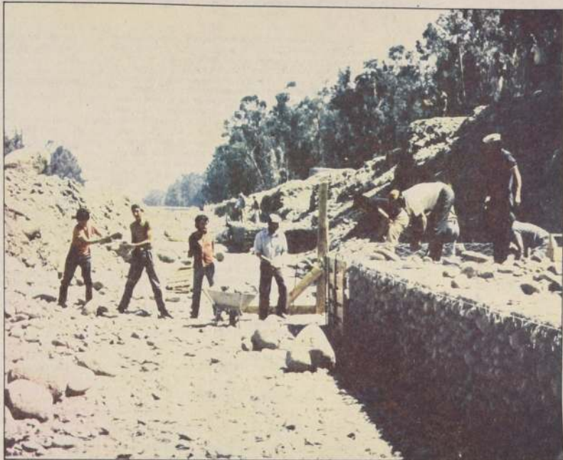
El término de las obras en la Avenida Circunvalación Américo Vespucio en el Área Metropolitana será uno de los 16 proyectos de Vialidad Urbana que ejecutarán los Ministerios de Obras Públicas y Vivienda con financiamiento proveniente del crédito BID-CORFO II, otorgado a nuestro país recientemente.

De cuatro mil personas serán ejecutadas en los programas que eje- cuta el Ministerio de Obras Públicas, se otorga al crédito de 290 millones de dólares otorgado por el Banco Inter- americano de Desarrollo. Los fondos se utilizarán para concretar 35 proyectos que generarán mano de obra corriente y ca- pital, además de profesionales y trabajadores de distintas especialidades. El subsecretario de Obras Públicas y Ministerio del ramo, brigadier Fernando Hor- maza, al ser consultado sobre los beneficios directos que re- sultará al proceso de reactivación del sector de la construcción, dijo que la obtención de este préstamo de mano de obra que abarcará el período de ejecu- ción de los proyectos cuya licitación se iniciará en los próximos meses. El brigadier Hormaza indicó que esta cifra indudablemente podrá incre- mentarse ya que el Ministerio entrega proyectos a empresas particulares que ganan las propuestas y ac- ciones, como administrador de las empresas, a su vez, gene- ran otras fuentes de trabajo que aún no es posible considerar, pero que se notará cuando comience el de- sarrollo de los trabajos. Todas las obras abordadas por (Pasa a la Pág. 12-A)