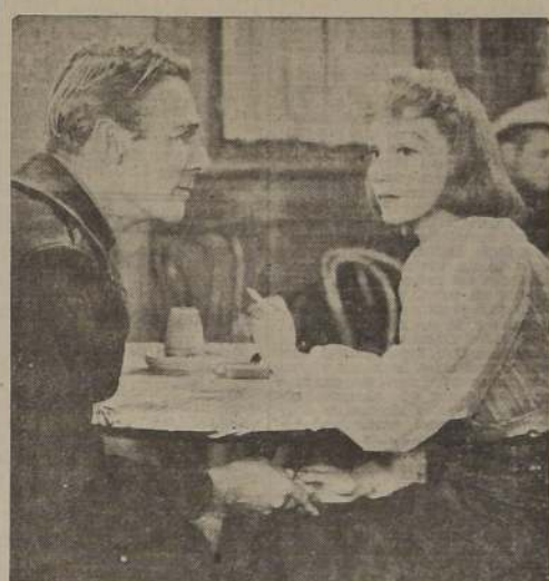
Elizabeth Bergner y Randolph Scott son los intérpretes del film del París ocupado realizado en los Estudios Universal y que obedece al sugestivo título "PARIS LLAMA". — Esta admirable producción va desde el Martes venidero al Teatro Continental