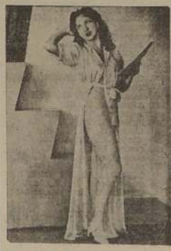
La capital, tienen fe y confianza en lo que anuncia y en lo que les promete y cumple.

Hoy como ayer los tiempos son de lucha. Vale decir, que teatro se le duerme se lo lleva la corriente. Pero debemos hacer una elogiada excepción del gran teatro chileno "Condor", el BALMACEDA que desde hace siete años consecutivos, sin subvención ni ayuda fiscal de ninguna especie, es el principal y constante animador de nuestras actividades escénicas, ofreciendo siempre un espectáculo variado, interesante y económicamente al alcance de todos los bolsillos. Por eso el BALMACEDA justamente se le denomina "La casa de todos" y algunos entusiastas dicen que es "La casa donde tanto se ríe y se ven las artistas de mayores encantos y sugerentes físicas". Cada sábado, como un tremendo "catcher" el Balmaceda