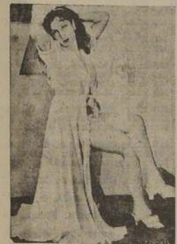
se cuadra con un enorme y valiosísimo espectáculo con el propósito de "Flanchar" al público, vale decir, con el objeto de obtener un exitazo de punta a punta.