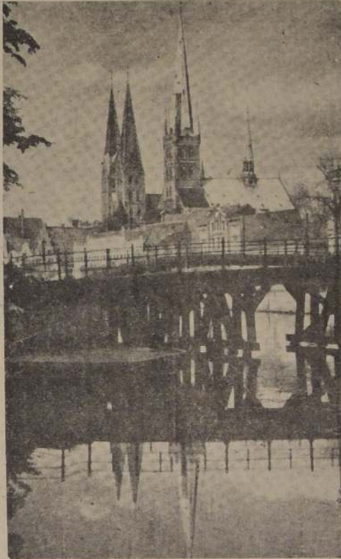
Un aspecto de Lübeck, a orillas del Báltico