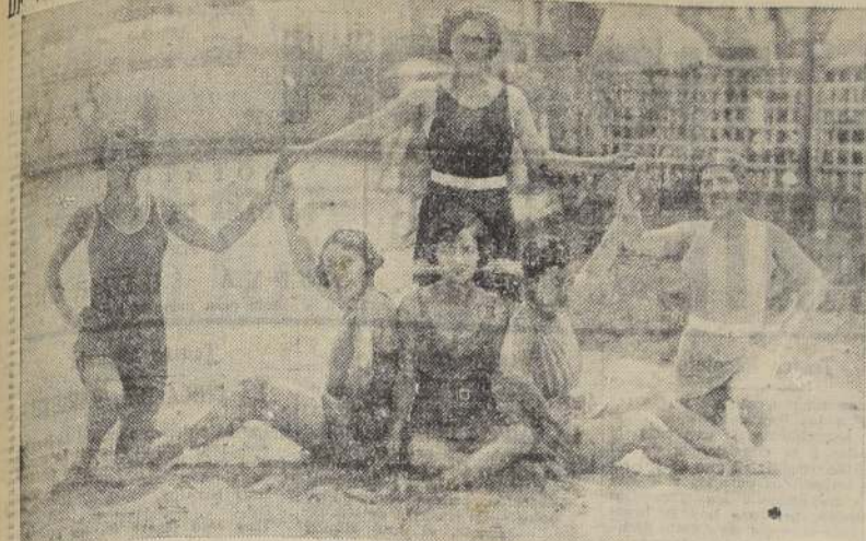
Una alegoría de sirenas.

LOS SABIOS SON LOS QUE BUSCAN LA SABIDURIA, LOS NECIOS PIENSAN YA HABERLA ENCONTRADO.