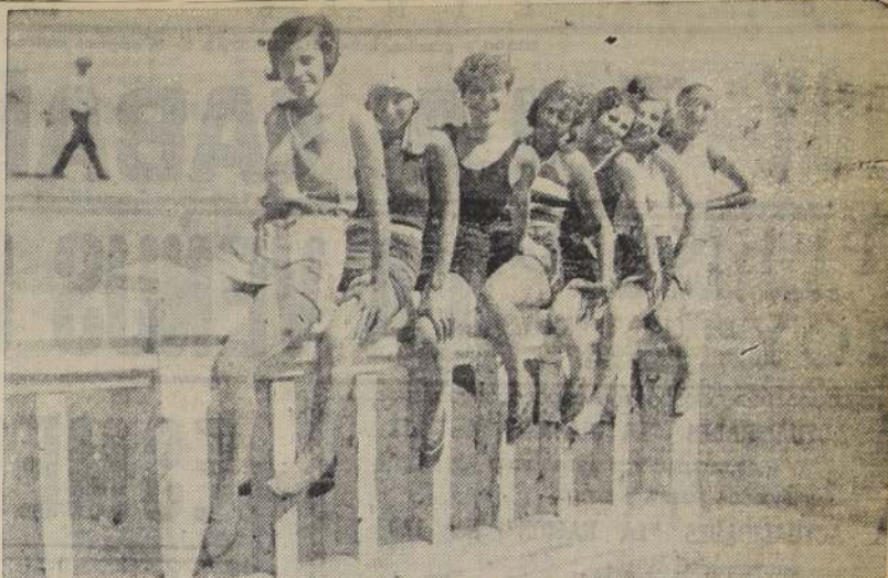
Sobre una cabal gadura inofensiva.