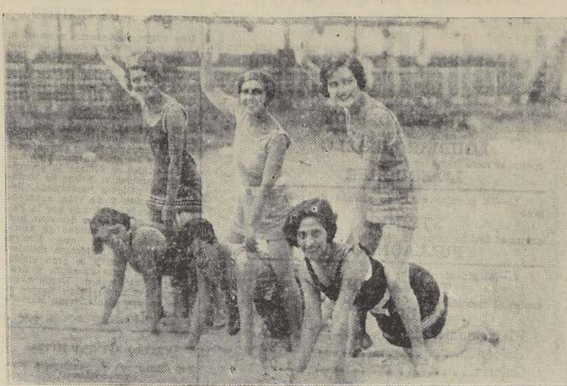
Esperando la orden del juez de partida.

El Departamento de Sanidad de la ciudad de las baratas, ha resuelto colocar letreros en todas las casas donde se usa MOSCALINA. De esta manera se pretende evitar la enorme mortandad que ha originado este insecticida. (Moscalsina mata instantáneamente las moscas, chinches, baratas, etc., pero es inofensivo al hombre)