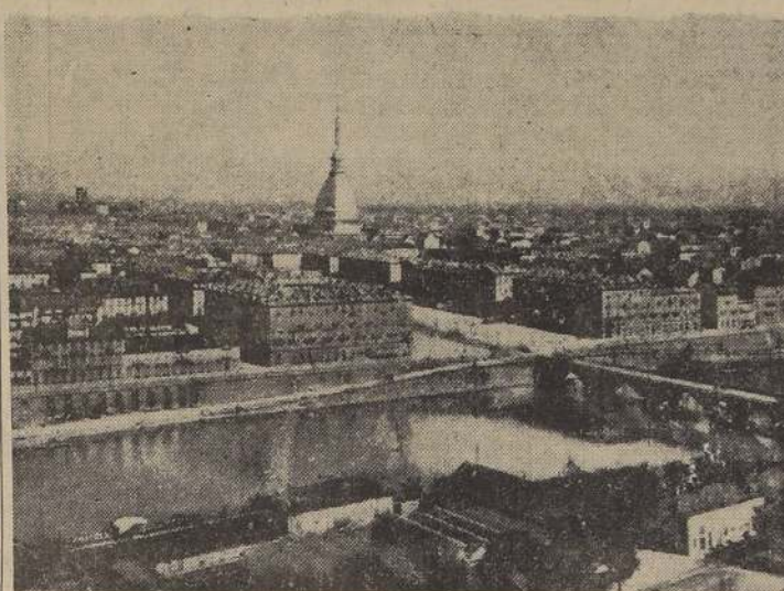
Panorama de Turin