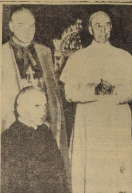
CIUDAD DEL VATICANO.— El Primado polaco, cardinal Stefan Wyszyński (izquierda), aparece aquí en una audiencia especial con el Papa Pío XII, el 14 de mayo. El cardinal hizo la visita con su secretario, quien aparece en primer plano.

El Presidente Eisenhower declaró esta noche, en un discurso de presupuesto, que "no hay precio para la seguridad".