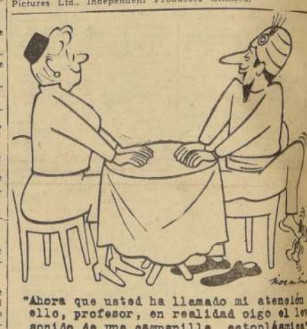
"Ahora que usted ha llamado mi atención a ello, profesor, en realidad oigo el sonido de una campanilla ectoplásmica."