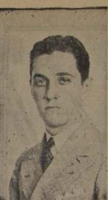
DISTINGUIDO INGENIERO PERUANO GRADUADO EN CHILE MUERE EN ACCIDENTE

SE AGRAVO EL SENADOR CUBANO DR. E. CHIBAS