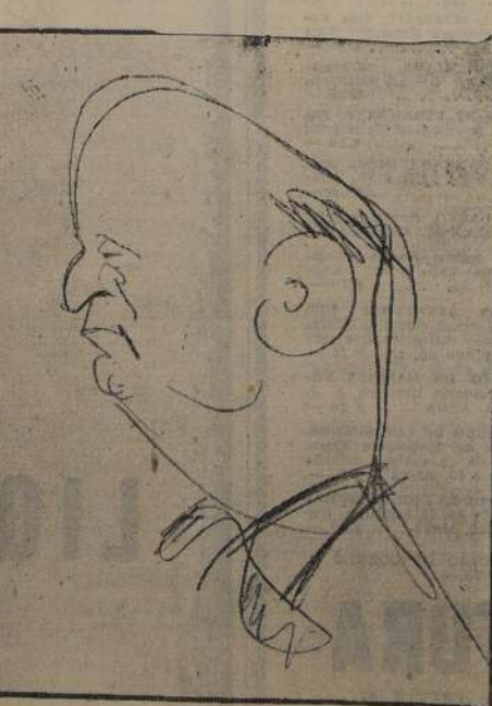
El notable director Erich Kleiber, que está dirigiendo una serie de conciertos sinfónicos en el Teatro Municipal.