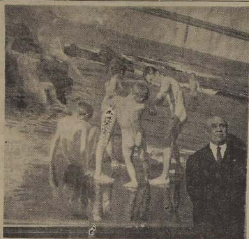
DON BENITO REBOLLEDO, el gran pintor nacional, que exhibe su exposición de obras en la sala del Banco de Chile. Aquí está junto a su obra: "Ante el mar".

Benito Rebollo Correa a sus 70 años, bien conservados, representa al movimiento realista en nuestra pintura, del cual es campeón. Indiscutiblemente es el mantenedor de nuestro prestigio en la pictórica chilena. Pinta desde los 5 años. Su nombre figura entre los grandes maestros de Chile, junto a los de Fossa Calderón, Juan Francisco González, Vicuña Zenteno, Richon Brunet, Valenzuela Llanos, Pedro Lira, Valenzuela Puelma, Pedro Burchard, etc. Ha tenido mala suerte, Empezó su carrera como decorador, y sus constantes estu-