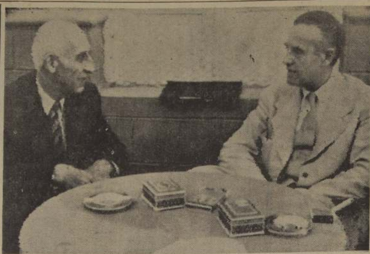
TEHERAN.— Dificultades con el petróleo.— La foto nos muestra a Averell Harriman, a la izquierda, enviado especial del Presidente Truman, en los momentos en que conferencia con el Premier iraní Mossadegh, sobre la disputa petrolera con Gran Bretaña.