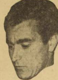
CARRIZO. — Actúa en el arco de River Plate, puntero del torneo argentino. Sus performances lo llevaron a su designación como reemplazante de Dominguez en el seleccionado.