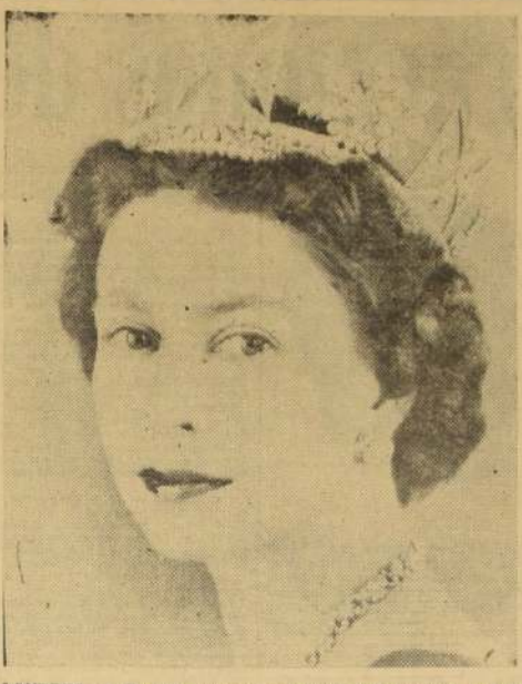
LONDRES. — En este grabado para darlo a la publicidad el 10 de octubre, la Reina Isabel II, luce una diadema, aros y un collar de diamantes y perlas.

El depósito se componía—según el anuncio oficial—de "cientos de armas individuales modernas y de decenas de miles de balas".