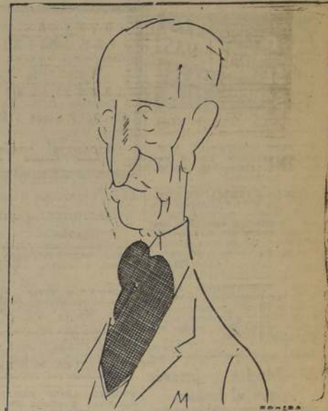
Lord Willingdon, jefe de la Delegación Británica y huésped de honor de la ciudad.

En el momento actual del mundo, frente al fracaso de regimenes y de doctrinas, ante la incertidumbre de todas las perspectivas y la desorientación de la espiral de la inconciencia, la experiencia, la ductilidad, la ecuanimidad y el "savoir faire" del periodista constituyen cualidades indispensables para llevar a buen término una misión plena de excelso color, como es la del "Quotidiano". En este sentido, el Gobierno de España ha estado acertado al designar para representarlo en Santiago a un hombre que comenzó a mirar la vida y a conocer los problemas humanos desde la pulsación de las intolicias. Junto a su padre, primero, y —en segunda— como di-