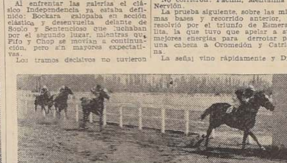
Bockara llega al disco con tres cuerpos sobre Sentencioso, que aventaja por dos a Sopló y Pío.

ninún interés y Bockara desfiló por el frente al disco con 3 cuerpos sobre Sentencioso que aventaja por dos a Sopló. Cuarto Pío, quinto Chop, sexto Coligny, séptima Oferta y octava y última Topa Topa que no entró en carrera se parte alguna. Tiempo: 1.59 3/5. A su regreso al pesebre la ganadora fue aplaudida por el público, aplausos que con toda justicia alcanzaron al preparador Villena, que ha sabido llevar a su pupila a un triunfo sobresaliente y al jockey Santander, que la condujo con admirable acierto. Se dio comienzo a la reunión con una de las series del premio Biente, handicap sobre 1,200 metros y en donde Belvedere se impuso en busca de la delantera, precedido por Pío y Oferta delante de Pío, Sopló, Sentencioso, Chop y Topa Topa, orden en que desfilaban por frente a la meta. Alzadas las cintas, Perilana, Pío y la delantera, precedida por Pío y Aquilón, Marie Rose, Diabolo Fuerte, Nigüncio, Belvedere, Petróleo y la