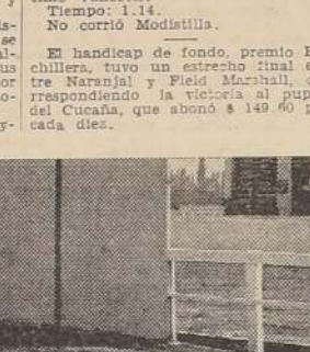
Feu d'Amour se impone sobre Copetin y Dúo.

ninún interés y Bockara desfiló por el frente al disco con 3 cuerpos sobre Sentencioso que aventaja por dos a Sopló. Cuarto Pío, quinto Chop, sexto Coligny, séptima Oferta y octava y última Topa Topa que no entró en carrera se parte alguna. Tiempo: 1.59 3/5. A su regreso al pesebre la ganadora fue aplaudida por el público, aplausos que con toda justicia alcanzaron al preparador Villena, que ha sabido llevar a su pupila a un triunfo sobresaliente y al jockey Santander, que la condujo con admirable acierto. Se dio comienzo a la reunión con una de las series del premio Biente, handicap sobre 1,200 metros y en donde Belvedere se impuso en busca de la delantera, precedido por Pío y Oferta delante de Pío, Sopló, Sentencioso, Chop y Topa Topa, orden en que desfilaban por frente a la meta. Alzadas las cintas, Perilana, Pío y la delantera, precedida por Pío y Aquilón, Marie Rose, Diabolo Fuerte, Nigüncio, Belvedere, Petróleo y la