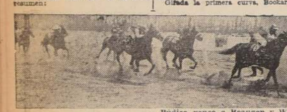
Púdica vence a Beaugen y Wico.

acto de presencia, ocho de los nueve inscritos, pues Auro rehusó el encierro, como oportunamente lo anunciaron. El grupo fue presentado en óptimas condiciones y eran Chop, Bockara y Sopló los que desfilaban en el conjunto. Las opiniones se manifestaron divididas entre Chop y Bockara, estando favorito el caballo con 400 bolacas más que la pupila de Villena, como puede verse por el siguiente resumen: