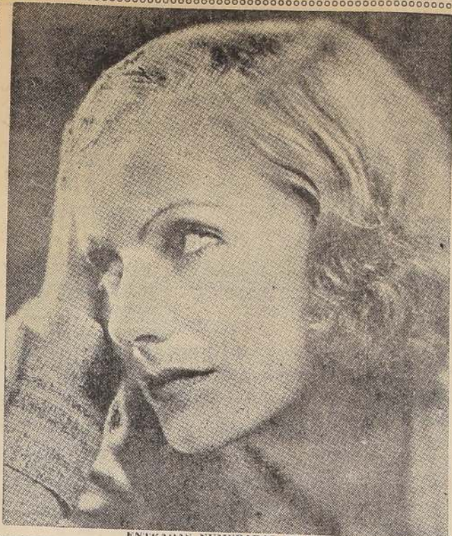
ENTRADAS NUMERADAS EN VENTA