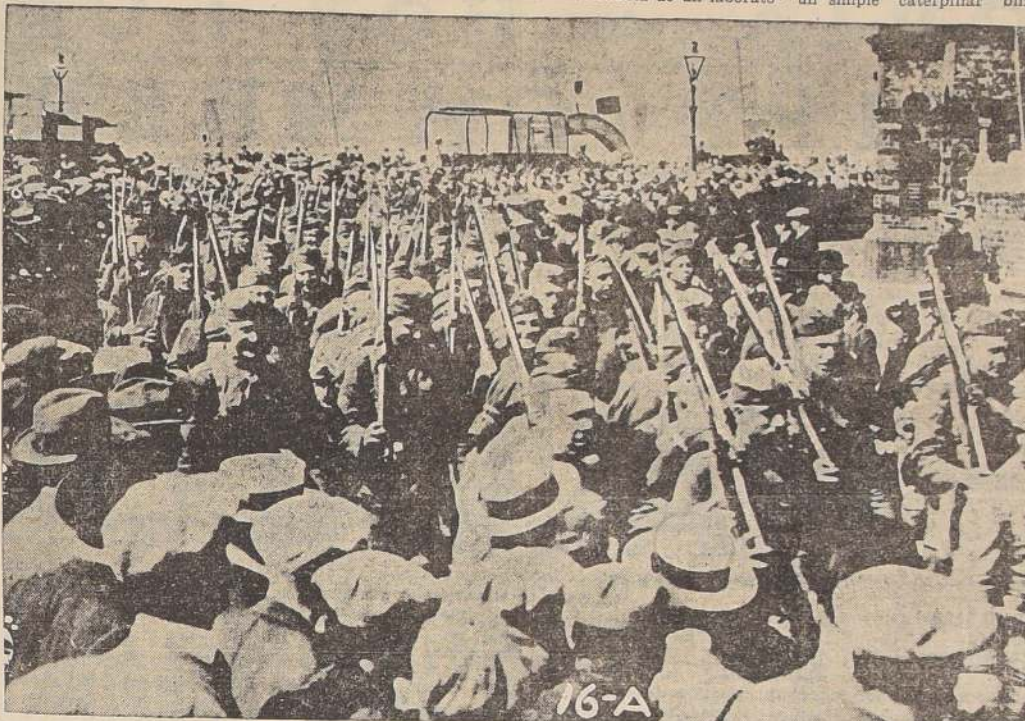
Tropas norteamericanas que llegan a Francia, para seguir inmediatamente con destino a los campos de instrucción.