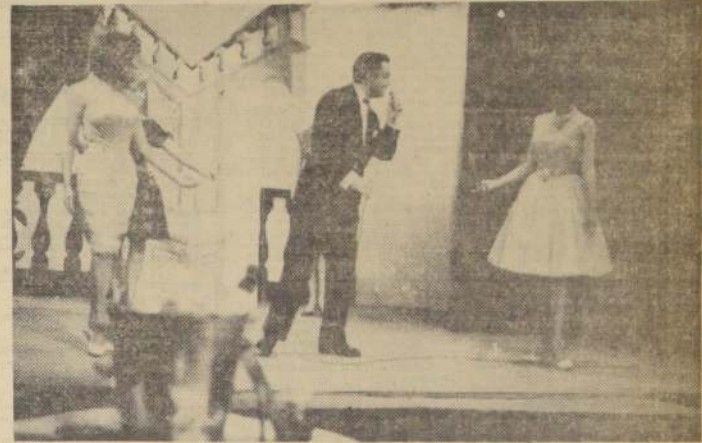
LEO MARINI, actuando ante la TV peruana, en Lima, y cuyas actuaciones constituyeron un éxito sin precedentes en la hermosa y señorial capital peruana. Leo Marini es otro de los destacados artistas que actuarán hoy en el Gran Show de GOLES Y GOLES, y que tiene por escenario el hall principal de nuestra casa periodística.

LA SEGUNDA FECHA Y ya estamos en otra vibrante jornada de GOLES Y GOLES. Hoy se cierra la recepción de los cupones que indican los totales de goles que se marcarán en los encuentros a jugarse esta tarde y mañana, por el torneo profesional de fútbol de primera división. El envío de cupones de provincias está marcando cifras que superan todos los cálculos señalando así el entusiasmo que en todo el país ha despertado este concurso tan sencillo e interesante. Como lo indican las bases, el cierre en el hall de LA NACION es a las 13 horas, y a mediodía en los locales comerciales a las 12 horas. Alonso e Hijos, Vidriera La Argentina y Radiolandia, y en la Corresponsalia de nuestro diario en Valparaíso.