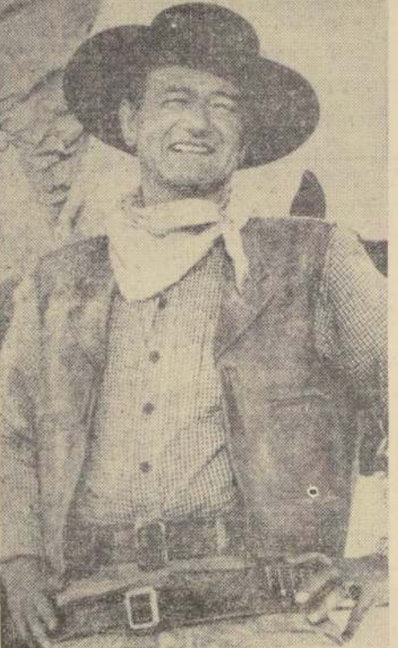
JOHN WAYNE John Wayne llegó a Madrid para filmación de "Circo"

dir el cuadro familiar esta magnífica obra shakespeariana.