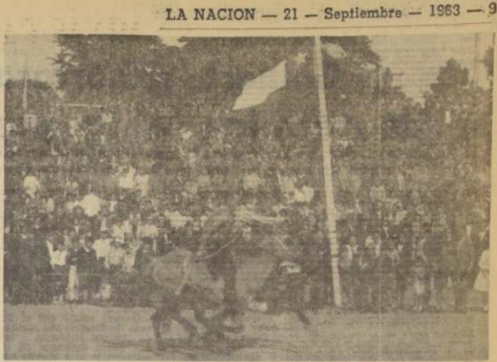
VALPARAISO.— CARRERAS A LA CHILENA.— En medio de gran animación se efectuaron las carreras a la chilena, en el Parque Alegre Barrios, de Playa Ancha, durante la fiesta campera organizada por la Municipalidad porteña. EN EL GRABADO, uno de los participantes, que parece correr alentado por el airoso pabellón patrio, que presidió el programa de estos días de esparcimiento, que han llegado a su fin.

En la Serena y a la Comisión Nacional de Santiago, para el efecto de que los elegidos entren a tomar parte en los concursos para los mejores empleados y obreros de la provincia y del país. La designación provincial se efectuará en octubre próximo y la nacional, a fines del presente año. (Rojo, Corresponsal.)