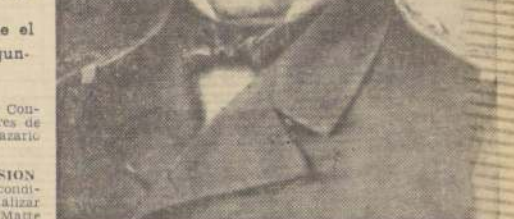
ESTA ES LA efígie del capitán de fragata Juan Williams, a cuya pericia y valor se debe la toma de posesión del Estrecho de Magallanes.