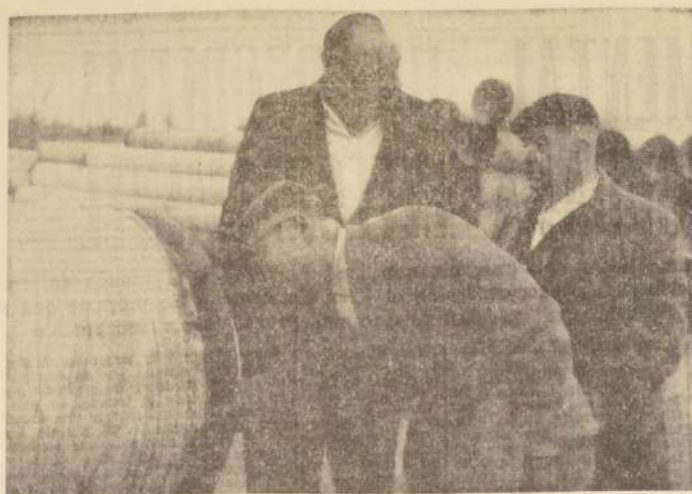
ABOVAMIENTO DE CANAL.— La Avenida Santa Rosa verá desaparecer el lunar que tiene en su trayectoria, constituido por el canal San Joaquín, que corre a tajo abierto en 1.300 metros. Para abovedarlo se utilizarán tubos de gran diámetro. EN EL GRABADO, aparece el Ministro de Obras Públicas, Edmundo Pérez Zujovic, examinando uno de estos tubos, durante la visita que hiciera a la Fábrica Nacional de Tubos, en compañía de los industriales.