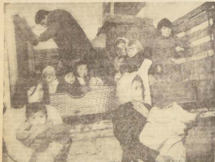
Alrededor de veinte familias de la Población "José María Caro" fueron evacuadas, ya que sus viviendas quedaron inhabitables a causa de las últimas lluvias. Fueron trasladadas con sus enseres, en camiones del Servicio de Asistencia Social, hasta el hogar de emergencia de Caritas, construido por la COEVI en dicha población. El Servicio de Asistencia Social entregará frazadas y colchones para los damnificados y Caritas proporcionará los alimentos. Por su parte, la Gobernación del Departamento Presidente Aguirre Cerdá se encuentra levantando medicinas, donde serán instaladas las familias que quedaron sin hogar. EN EL GRABADO, pobladores con sus pequeños están siendo transportados hasta el hogar de emergencia.

En cuanto al anillo de circunvalación, se acordó activar la pavimentación de las pistas en las Avenidas Manuel Rodríguez y El Progreso, en San Miguel y La Granja. Esto permitirá unir las comunas del Gran Santiago sin necesidad del paso de vehículos por el Centro de la capital, descongestionando el tránsito.