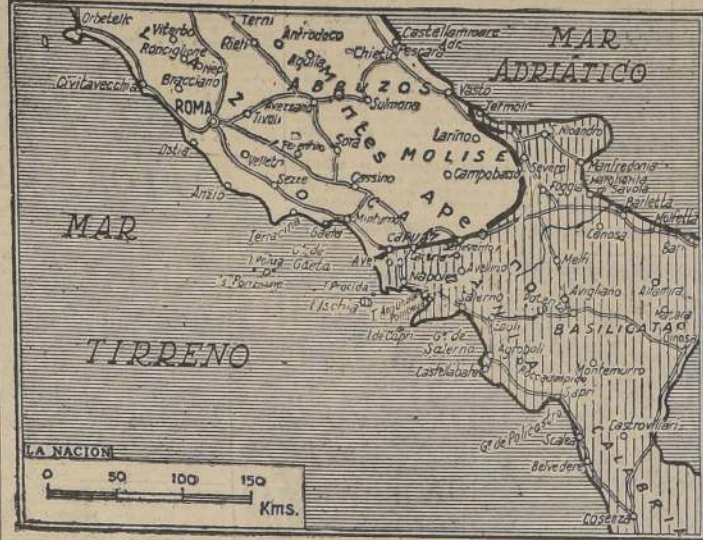
La línea gruesa señala, en forma aproximada, el frente de batalla después de la ocupación de Caserta y Capua por las fuerzas de Mark Clark.

Con el cruce se rompió la primera defensa alemana antes de Roma en un punto a lo largo de