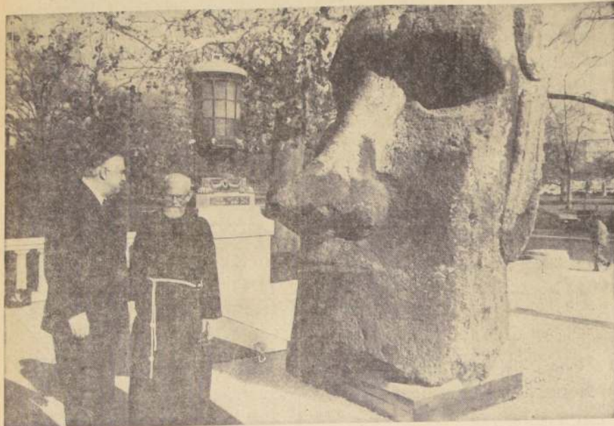
UN MOAI de la Isla de Pascua turística por Estados Unidos y, de paso, sirve de anfitrión para atraer turistas hacia la romántica Rapa Nui y para dar pruebas de los tesoros arqueológicos de la Isla. El viaje del Moai lo organizó la Fundación Internacional para la Preservación de Monumentos en Washington. En el grabado, el padre Sebastian Englert, monje capuchino de 80 años que vive en Isla de Pascua desde 1935, conversa con el Secretario General de la OEA, Gale Plaza, en los momentos en que el Moai llega a la sede de esta institución.