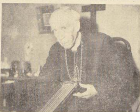
Su dedicación a la cithara ha sido una distracción. Su entrega a la Iglesia ha sido su compromiso.

90 AÑOS DE EDAD, 67 DE SACERDOTE Y 22 DE OBISPO