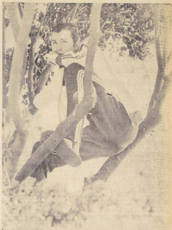
El astro alemán Franz Beckenbauer, no tomó parte en el entrenamiento de sus compañeros, pero buscó la sombra de un árbol para mirar el trabajo de los demás.