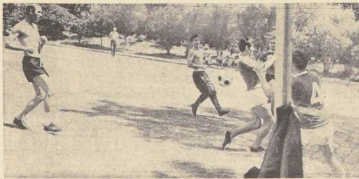
Durante una hora practicaron en el Estadio Manquehue los seleccionados alemanes. En el grabado, un pasaje del suave entrenamiento de los vicecampeones del mundo.