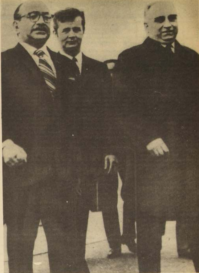
VARSOVIA. El canciller chileno, Clodomiro Almeyda, es recibido por su colega polaco Stefan Jedrychowski a su llegada al aeropuerto local. Almeyda cumple una gira de un mes por los países socialistas de Europa y algunos occidentales.

Agradeció durante la entrevista la estancia en Chile de especialistas en minería polacos y expresó la confianza en que podrían contar con una asistencia similar en el futuro. También se refirió Allende al nivel alcanzado por Polonia en la construcción de barcos y dijo que era un asunto que tenía particular interés para Chile en vista del desarrollo del programa sobre la flota mercante. El Canciller chileno visitó hoy al Ministro de Relaciones Exteriores polaco Stefan Jedrychowski, recorrió Varsovia y en horas de la noche asistió a la representación de la ópera "Rey Roger" de K. Szymanowski en el Gran Teatro.