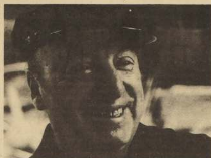
PABLO NERUDA, poeta y Embajador de Chile, en Francia.

Luego, con cierto orgullo, los invita a recorrer la mansión, la