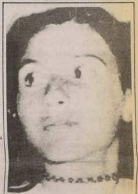
ROMA, ITALIA. — Foto de archivo de Emanuela Orlandi, quien fue secuestrada el 22 de junio y que según un llamado telefónico habría sido asesinada por sus captores y su cadáver estaría en la maleta de un automóvil.