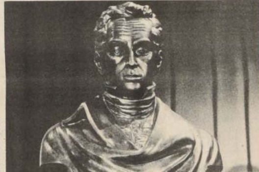
Busto de Simón Bolívar