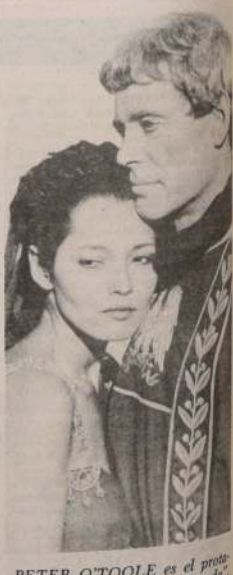
PETER O'TOOLE es el protagonista de la serie "Masada", que es un homenaje al pueblo judío en su lucha por conservar su identidad frente al ataque romano.

En muchos aspectos la película es un homenaje al pueblo judío, y un documento sobre uno de los momentos más duros de su historia.