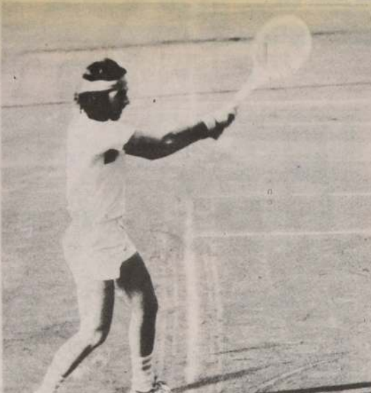
El tenista chileno Hans Gildemeister aparece entre los cabezas de serie del torneo de tenis en canchas de arcilla, que se jugará en Newton, Nueva York.

Como prueba se da el número de patente y el del notario de Lugano donde está depositada la declaración bancaria y se espera que "se restablezca la justicia y la verdad" para que "Udinese no tenga que recurrir los perjuicios presentes y futuros, directos e indirectos", además de tener que pagar el anticipo hecho por la "Groupings" al Flamengo (más de medio millón de dólares) por el contrato de Zico.