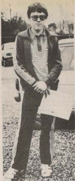
FE: Manifiesta que seguirá entrenando firme, ya que a su juicio puede dar mucho más en natación.

Al finalizar nuestra entrevista el nadador manifestó: "El sacrificio que implica la natación vale la pena y si puedo voy a continuar, porque creo que aún puedo dar mucho".