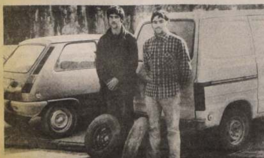
Se especializaban en robar autom viles y furgones desde talleres y compraventas de v h culos. Ayer fueron arrestados por oficiales de Investigaciones de Chile y puestos a disposici n de la justicia ordinaria.

La captura de los delincuentes permiti  la recuperaci n de los v h culos evaluados en medio mill n de pesos. Ambos antisociales quedaron recluidos en el Centro de Detenci n Preventiva, ex C rcel P blica.