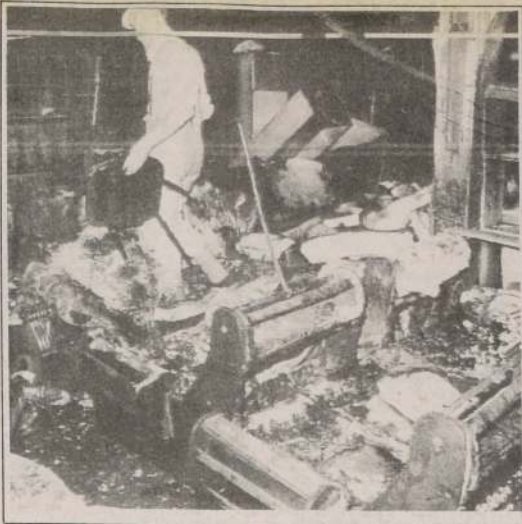
BELFAST, Irlanda del Norte.— Un hombre observa los daños causados a una tienda de muebles, después de una serie de atentados con bombas durante el fin de semana.

Dijo que si Nicaragua quiere la guerra, Honduras desea la paz y que está dispuesta a retirar los 130 asesores militares que hay en territorio hondureño si Nicaragua hace lo mismo con los 17.000 asesores soviéticos, cubanos y de países del este que dijo existen allí.