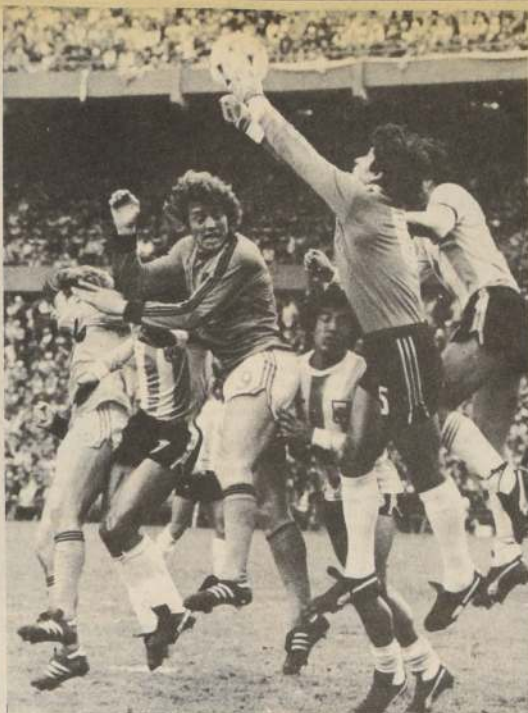
Ubaldo Fillol, arquero de River Plate y de la selección argentina, es la baja más importante para el amistoso que jugarán en Asunción ante la selección guaraní.

La organización de la laboriosa jornada estuvo a cargo del club representativo de la Escuela Militar, dejando entrever, una vez más, que a la esgrima chilena le aguarda un halagüeño porvenir.