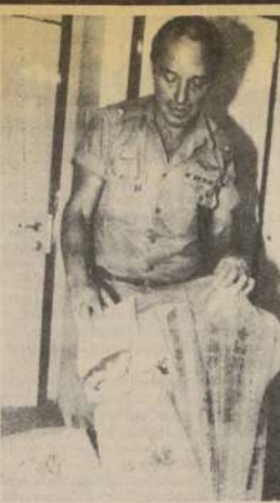
Un policía muestra elementos de propaganda anticomunista contenidos en un globo que cayó cerca de Tel Aviv. El globo fue lanzado en Taiwán con destino a China.

"En Cándinas (en el norte del estado) han estado sin alimentos, gasolina y gas para cocinar en los últimos dos días", dijo. "Hicimos dos intentos por llegar a ellos esta mañana en helicópteros, pero fracasaron".