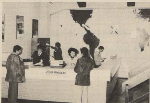
NUEVA OFICINA DE CORREOS