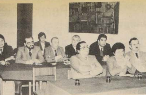
Los distribuidores del nuevo diario "LA NACION", que será tabloide a todo color, con revistas y suplementos, se reunieron en el Hotel Tupahue de la capital, para conocer las medidas de distribución, adoptadas por la empresa. En la foto, un aspecto de la reunión citada.

El día 11 de julio de 1983, se publicó el Balance del COLEGIO INGLES MACKAY. Por error de imprenta decía: Colegio Inglés McKay S.A.; debiendo decir: COLEGIO INGLES MACKAY S.A.