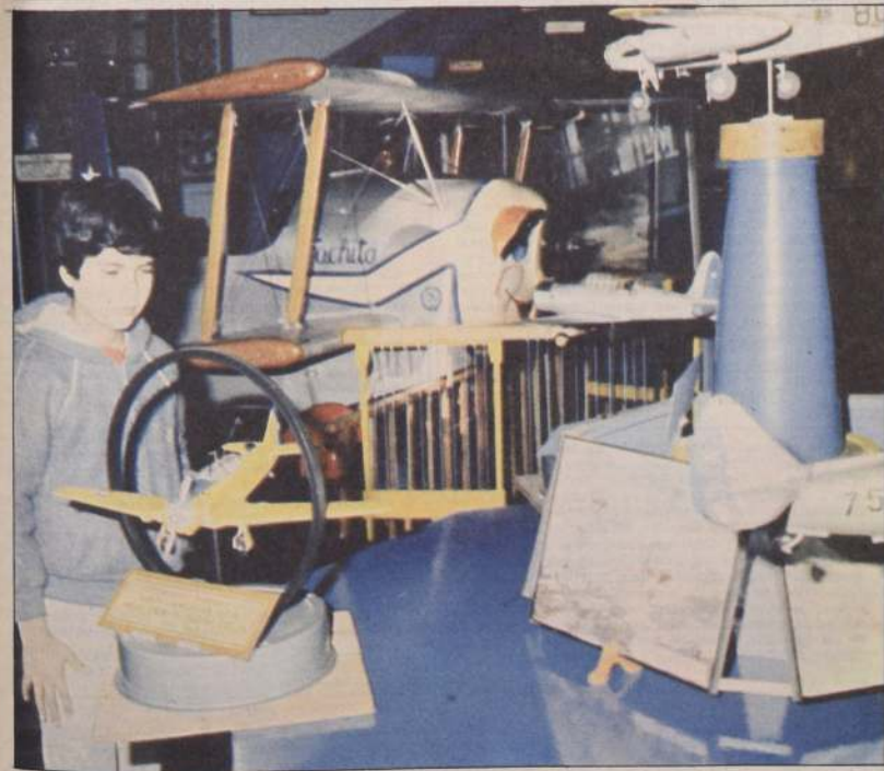
GLORIAS DE LA AVIACION CHILENA

El Museo Nacional de Aeronáutica, cumple hoy 39 años y está a cargo del general de brigada aérea (A), Eleodoro Calderón Loyola. Al mediodía habrá en él un acto especial con asistencia de autoridades. En la foto, una estudiante observa una de las reliquias. (Inf. Pág. 5-A).