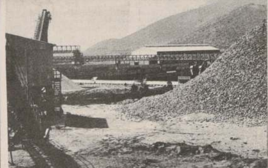
Chile producirá dos millones de toneladas anuales de cobre a fines de la presente década.

"Todos estos caminos tienen una concreción real o se estudian sus posibilidades. CODELCO se ha asociado con empresas extranjeras en este campo. Y, en lo interno, existen dos o tres proyectos para aumentar o mejorar la actividad semielaboradora de cobre. En diversas oportunidades firmas extranjeras han solicitado a la Comisión Chilena del Cobre los antecedentes que les permitan completar estudios de factibilidad de instalación de una planta de colada continua próxima a los actuales yacimientos en explotación."