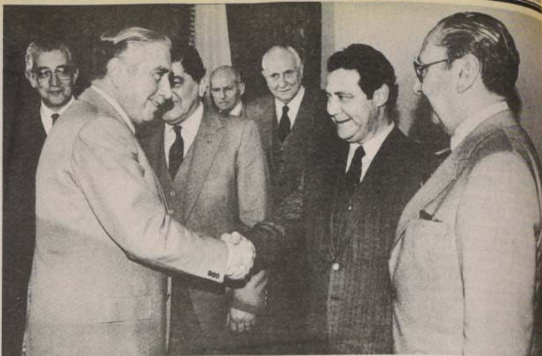
Una ronda de consultas con ex Ministros de Estado inició ayer el Presidente Pinochet. En la fotografía S. E. saluda al ex Ministro Carlos Quiñones, mientras observan el general, Diego Barbas Valdés, el vicealmirante Ismael Huerta, Renato Damilano, y el mayor general Rolando González Acevedo.

Manifestó el general Hernández que "la restricción dispuesta si bien es una medida de excepción está establecida en la Constitución y en las leyes vigentes. En situaciones análogas ha sido aplicada por casi todos los gobiernos que ha tenido el país y en todas las épocas. Ello permite asegurar la paz, tranquilidad y el resguardo de los bienes públicos y privados".