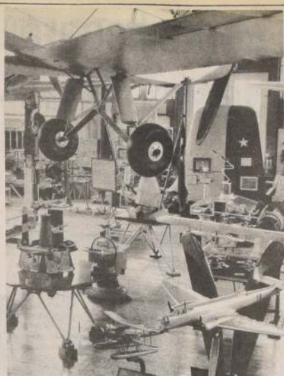
Interior del Museo Aeronáutico. Pueden observarse valiosas piezas de motores y aviones a escala. El constituye una reliquia de la aviación nacional.