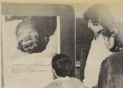
Las imágenes de la exposición fotográfica revelan una dramática realidad, como la que se aprecia en esta toma.

El tercer ciclo será en el Hospital del Salvador, el 22 de julio, a las 11.30 horas, en el Auditorium Lucas Sierra; Hospital de la Universidad Católica, 11 de agosto, a las 8.30 horas; y Hospital Paula Jaraquemada, 9 de septiembre, a las 8.30 horas.