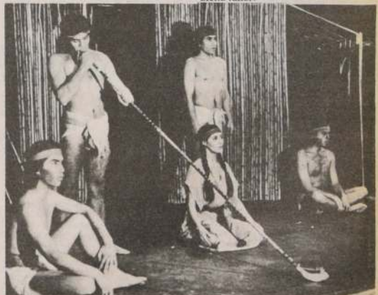
La obra "Lautaro", de Isidora Aguirre, ganó el año pasado el Concurso de Dramaturgia Eugenio Dittborn, y luego su montaje se constituyó en éxito de la temporada '82.

dramaturgia en la Escuela de Teatro, para perfeccionar el texto de su obra con la asesoría de docentes de esa unidad. Si el lugar de residencia del dramaturgo no es el Área Metropolitana, se hace acreedor además de una beca por tres meses para poder asistir a dicho taller.