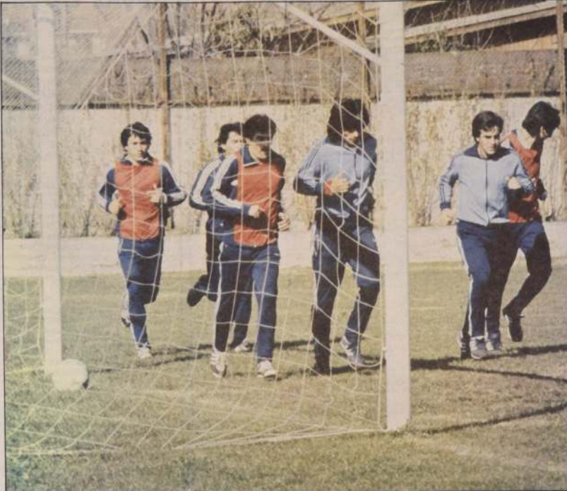
La selección nacional de fútbol efectuó ayer un intenso entrenamiento previo a su viaje de hoy a Bogotá. Mañana, en el estadio "El Campín", enfrentará al representativo colombiano, que se prepara también para la Copa "América". Chile jugará posteriormente frente a las selecciones de Bolivia, Perú y Paraguay.

El robo de estas piezas se produjo el sábado pasado alrededor de las 14.00 horas, en la Sala Chile del Museo, durante el horario de visita, en un mo-