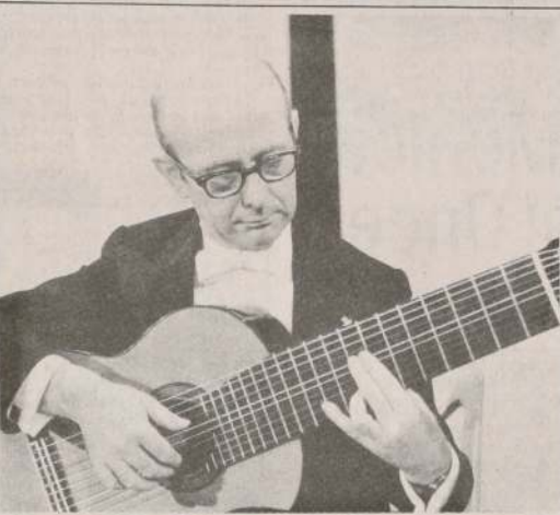
El concertista en guitarra Narciso Yepes, arribó en la tarde de ayer al país para cumplir un ciclo de recitales, entre ellos, el programado en Temuco el próximo viernes.

BAGDAD.— El primer largometraje árabe en dibujos animados, titulado "Al Amiera na al Nahr" (La princesa del río) fue completado por el Centro Árabe de Cine de Animación, cuya sede se encuentra en Bagdad (Irak). El realizador iraquí Faisal Al Yassiri dirigió este largometraje que se basa en una leyenda en la que se cuenta la historia de un hombre y de su lucha por conquistar fama y gloria. El filme está siendo lanzado en el mundo árabe gracias a una compañía publicitaria en la prensa de los países del Medio Oriente.