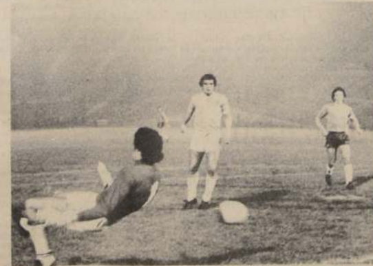
Uruguay jugando contra Chile en el Estadio Nacional. Ahora, los seleccionados de la "celeste" iniciarán una gira previa a la Copa "América".

A principios de octubre la selección volverá a Montevideo, partiendo nuevamente en noviembre hacia Australia, en donde participará en un cuadrangular.