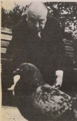
ALFRED HITCHCOCK es el director de la cinta "Los Pájaros", una de sus más destacadas realizaciones.

"Los Pájaros" es una de las mejores cintas de Alfred Hitchcock. Tiene varios premios a su haber y siempre ha sido bien ponderada por la crítica especializada.