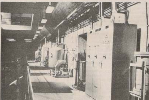
A través de un curso de alto nivel implementarán nueva tecnología para la industria nacional.