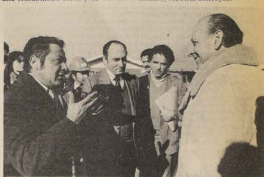
El intendente de la Región Metropolitana, mayor general Carol Urzúa, conoció las inquietudes de 504 trabajadores del POJH que laboran en un proyecto de pavimentación en la Población La Faena, durante la visita efectuada ayer en la mañana a la comuna de Nuñoa.

Finalmente, el mayor general Carol Urzúa indicó que el diálogo entre autoridades y la comunidad es constructivo, al igual que los trabajos en ejecución en las poblaciones, ya mientras ustedes construyen, otros destruyen.