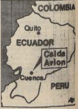
El mapa muestra el lugar donde cayó el avión militar ecuatoriano, luego de estallar en el aire, provocando la muerte de 120 personas. El hecho, constituye la tragedia más grande de Ecuador.

Describió las cintas, señalando que mostraban "actos sádicososos que no parecen ser violentos".