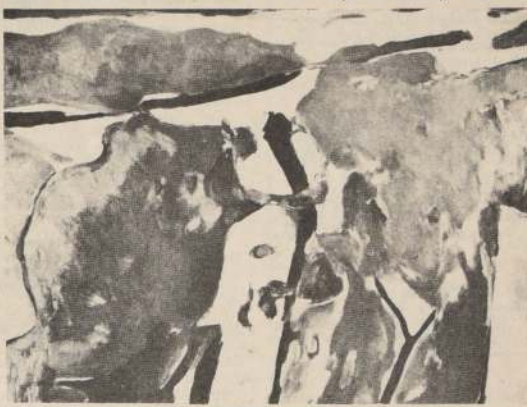
Cuadro de Augusto Barcia.

pinceles, su enfoque es mucho más europeo que lugareño. Es un expresionista, también, si se consideran al-