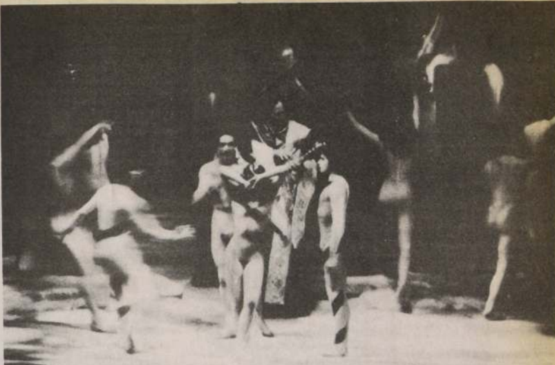
Una escena de la ópera "Tannhäuser", de Wagner, que abrió la temporada lírica '83 del Teatro Municipal.

El escritor y periodista indicó finalmente que su carrera en el futuro se orientará decididamente por el teatro y la literatura.