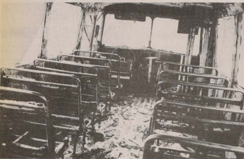
Hechos como éste, la quema de un microbús del recorrido Ovalle Negrete N° 56, ocurrido en la mañana de ayer en Independencia con Pérez Cotapos, así como diversas acciones destinadas a alterar el orden público, motivaron al Gobierno a decretar el toque de queda entre las 20 y las 24 horas.