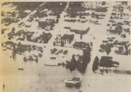
VICTORIA, Brasil. La ciudad de Victoria es una de las regiones más afectadas por las inundaciones donde más de 200 mil personas fueron obligadas a abandonar sus hogares.