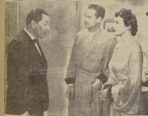
Warner Oland, creador del célebre personaje del detective Chan, en una escena de la película que estrena hoy el Teatro Metro

HOY ESTRENA "CHAN EN LA OPERA" EL TEATRO METRO