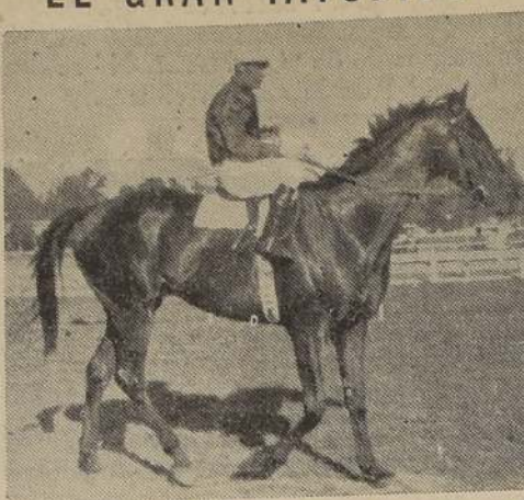
PALAIS ROYAL, el crack de las pistas chilenas y que aparece sin enemigo serio para el "Gran Premio Viña del Mar", prueba física de la reunión de pasado mañana en el Sporting Club y última competencia de importancia en la temporada que termina.