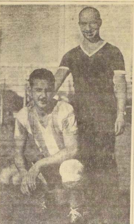
sudamericano, porque, en el y al derrojar en un match