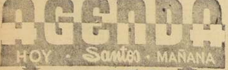
HOY... SANITO... MANANA

Honores y trabajos tiempo ha los dió al olvido, pero siempre recuerda su pellejo curtido la presión luctuosa del dulce Nazareno.