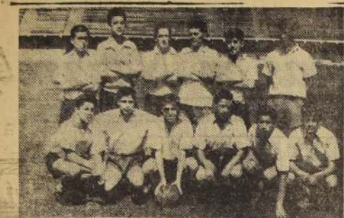
JORNADA "CADETE" — Otra vibrante y atrayente jornada vivieron el domingo último, los pequeños cracks de nuestro fútbol. La breva fue, una vez más, reñida y emocionante. En los combates, las escuadras penales de Magallanes y Unión Española se dividieron honores, aplausos y puntos. Los otros encuentros también resultaron interesantes. En los grabados, al extremo izquierdo, el elenco de Primera División Infantil de Magallanes, que empató a 1 con