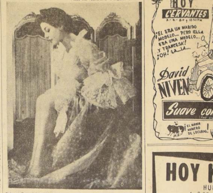
Esta es Emma Penella, la hermosa artista madrileña que acaba de ser premiada con el "Oscar español" a la mejor actriz del cine producido en la Península

Anualmente, en un concurso que realiza desde hace diez años, la revista española de cinematografía "El último Cuplé", reparte lo que ha venido llamándose el "Oscar español" a los mejores actores españoles y extranjeros, así como a los mejores directores de cine españoles y extranjeros. La concesión de este premio se hace a través de una votación popular. Me aquí la lista de este año: MEJOR ACTRIZ ESPAÑOLA: Emma Penella ("El último Cuplé"). MEJOR ACTRIZ EXTRANJERA: Giulietta Masina ("La Strada"). MEJOR ACTOR ESPAÑOL: José Suárez ("Calle Mayor"). MEJOR ACTOR EXTRANJERO: Marlon Brando ("Un tranvía llamado deseo"). MEJOR DIRECTOR ESPAÑOL: Juan de Orduña ("El último Cuplé"). MEJOR DIRECTOR EXTRANJERO: Federico Fellini ("La Strada").