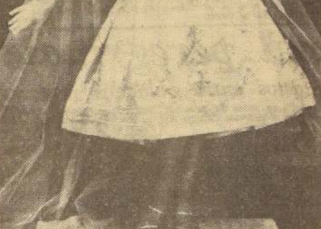
EL TRAJE DE NOCHE CORTO tiene muchas adeptas entre las elegantes parisienas. "CAMARGO", modelo de Nina Ricci, de París, es de orgánica rosada, con aplicaciones de rosas bordadas y motivos de perlas y lentejuelas doradas. Un vaporoso echarpe de tul rosado completa el conjunto.

¡Qué ingrato los hombres, que pronto olvidan la noble lección de amor y de paz que los Reyes Magos dieron al mundo! Con los pliegues de sus mantos y postrados de rodillas defendieron al Niño de la ira de Herodes. Coronaron su frente con diamantes y piedras preciosas. De mitra e incenso rodearon su cuna de paja. Cubrieron su cuerpo con ricas telas, adornaron el pesebre con muchos juguetes y regresaron a sus reinos por otros caminos... que no eran de Herodes. — Santiago, 24 de diciembre de 1957.