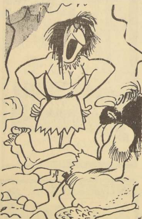
LA FELIZ ERA DE LAS CAVERNAS. — "¡Baja los pies de la mesa, maldito!"

—La novela? ¿El teatro? —Original, lo que se dice vulgarmente original, ninguno —replicó el dominó—. Me he especializado en los grandes maestros de la literatura. Ahora estoy escribiendo la continuación del "Quijote".