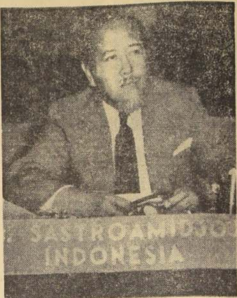
NEUVA YORK.— El Embajador de Indonesia ante las Naciones Unidas, Dr. Ali Sastroamidjojo, aparece en esta radiografía, en el momento en que hablaba ante la televisión norteamericana, expresando que todos los intereses holandeses deberán abandonar su país si Holanda mantiene en posesión a la Nueva Guinea.