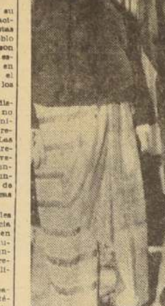
WASHINGTON. — Eisenhower recibió en la Casa Blanca al Presidente de Burma, U Win Aung, y al Embajador U Win. El Presidente de Burma viajó a los Estados Unidos por razones de salud.

Hoy, sin embargo, el espectáculo era más animado. Los oficiales de ambos lados se mi-