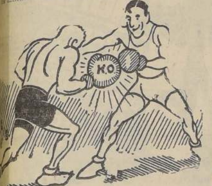
El campeón de Chile, Juan Peñaillo, en un momento de su combate.