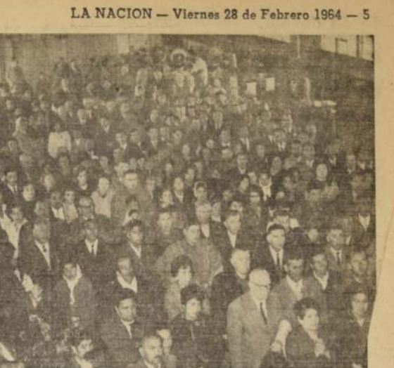
EL ABANDERADO NACIONAL DE LA DEMOCRACIA EN PUERTO MONTT.— La nota gráfica muestra parte del numeroso público que se dio cita en el aeropuerto de Tupal, en Puerto Montt, el miércoles último, bajo un temporal de lluvia y viento, para saludar al candidato nacional a la presidencia de la República, senador Julio Durán, que viajó para visitar las localidades de Chile y Aisen, lo que no pudo hacer en su gira anterior.

Personal del Servicio de Minas del Estado, dependiente del Ministerio de Minería, inició una amplia investigación para determinar las causas precisas que provocaron el derrumbe de la mina "Flor de Te", y que mantuvo sepultados a siete obreros, cinco de los cuales estuvieron durante más de 135 horas, hasta que fueron rescatados.