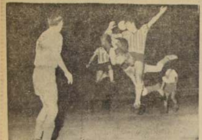
UN BUEN COMIENZO tuvo el equipo de Coquimbo-Grav frente al seleccionado uruguayo de OFI en el Torneo de Confraternidad Sudamericana. Luego decayó en su acción y fue derrotado por seis tantos contra uno. En el grabado, una escena del match, Gentileza de Jacobo Bressler.