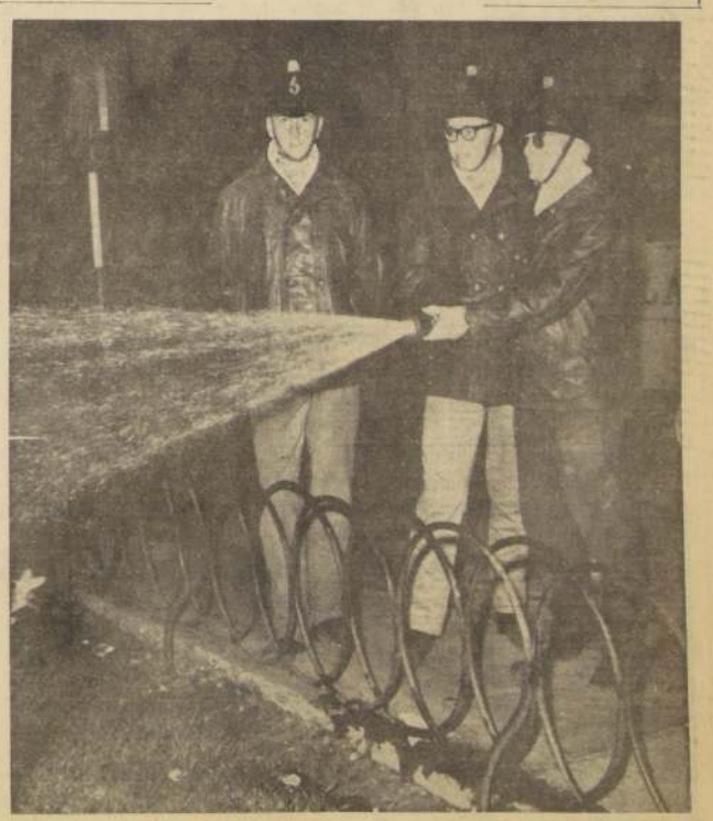
Más de seiscientos voluntarios de las once compañías de agua del Cuerpo de Bomberos de Santiago, al mando de sus comandantes y oficiales, se hicieron cargo del riego de los jardines de los principales paseos públicos de la comuna de Santiago, Providencia y Las Condes, que son las que atiende la institución. En el grabado, voluntarios de la Quinta Compañía riegan uno de los prados de la Plaza de la Constitución, en la madrugada de ayer viernes. (Información en la página 3.)