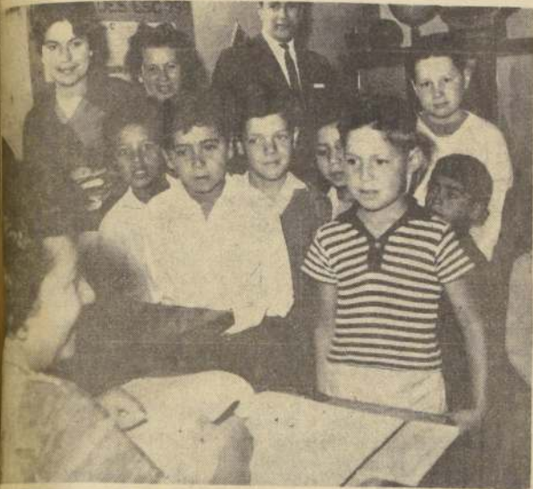
Una escena de las presencias ayer en la mañana en la Escuela Pública N.º 269, que funciona en el Paradero 17 de la Gran Avenida.