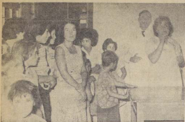
En la Población José María Caro se ha realizado una activa campaña para ayudar a combatir el brote epidémico de poliomielitis que apareció en algunos sectores de la ciudad.