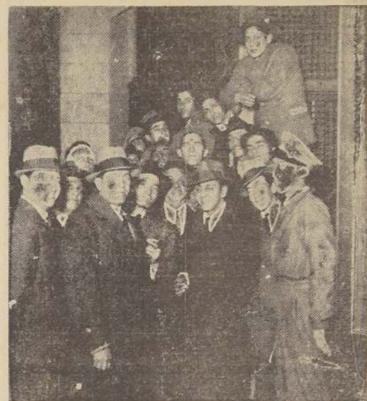
Los que quedaron presos frente a un ascensor del edificio