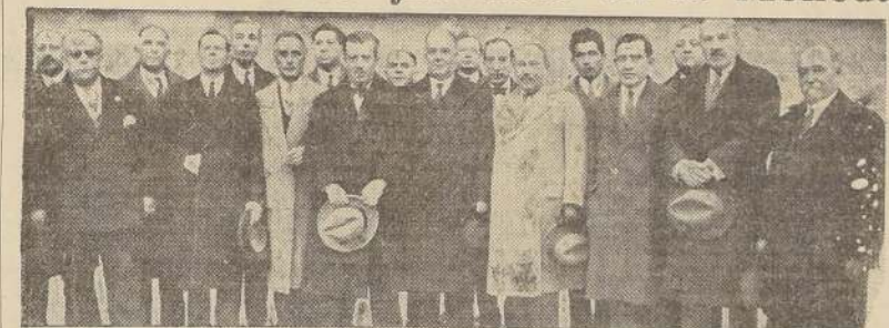
Grupo de delegados ferroviarios que se entrevistaron con la Junta de Gobierno.

En la tarde de ayer, el Directorio y miembros de la Sociedad de «Ferroviarios Jubilados» estuvieron en la Moneda a saludar a los miembros de la Junta de Gobierno y les hicieron entrega de un pliego de peticiones, junto con brindarles su más franca adhesión.