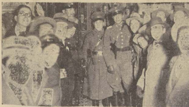
Carabineros y grupo de curiosos frente a la puerta principal de la Bolsa de Comercio.

Como decíamos más arriba, los compradores de oro no opusieron, en general, resistencia alguna a la labor de los oficiales y agentes. Sólo uno de ellos pretendió resistirse al cumplimiento de la misión que llevaban éstos, en vista de lo cual fue conducido, desde su negocio en el Portal