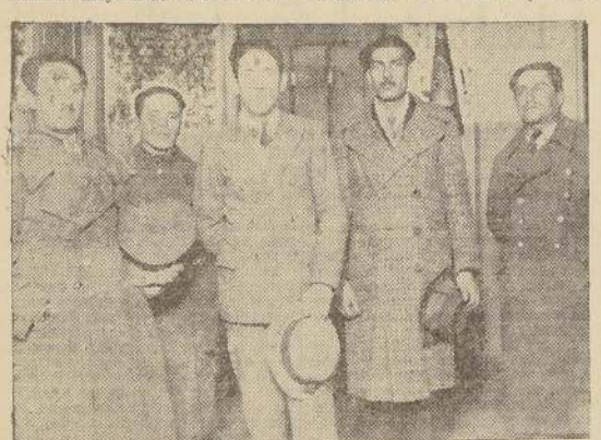
La delegación de tranviarios en nuestra imprenta

Anoche realizaron un comicio los obreros tranviarios pertenecientes al Sindicato Industrial de la Cia. Chilena de Electricidad, con el objeto de manifestar su adhesión a la Junta de Gobierno y hacerle entrega de un pliego de peticiones. El comicio se realizó dentro del mayor orden, participando en él la inmensa mayoría de los obreros tran-