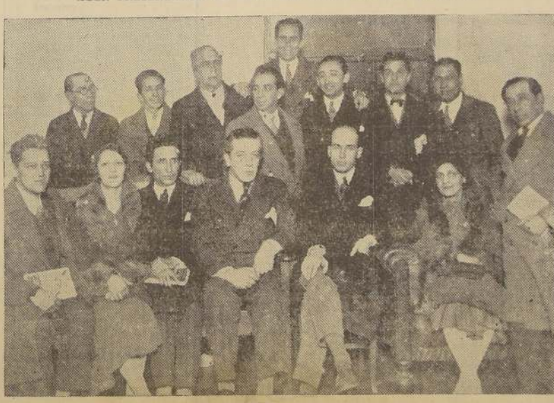
La comisión del "Sindicato Teatral de Chile", que presentó el memorial a la Junta de Gobierno.

AYER PRESENTARON UN MEMORIAL A LA JUNTA DE GOBIERNO