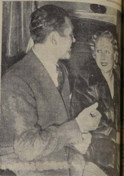
En la cabina del "Europa", Max Schmelling con su esposa, Anny Ondra, que fue a recibirlo a Buenos Aires para el próximo match con el negro Joe Louis, por el campeonato del mundo