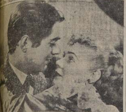
Power y Alice Faye, que comparten los honores de la producción de la 20th Century-Fox.

El próximo viernes se ha estrenado en el Teatro Metro la superproducción de la 20th Century-Fox, "El Viejo Chicago", que se llevará a cabo en las postrimerías del siglo pasado, cuando era una ciudad en crecimiento donde reina-