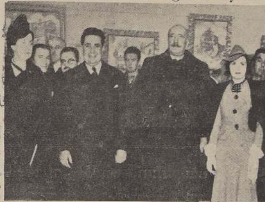
El Embajador del Perú, Excmo. señor Rafael Belaúnde, y otros invitados a la inauguración de la exposición del pintor peruano Teófilo Allain, efectuada ayer en la sala del Banco de Chile.

Bellas Artes Teófilo Allain, inauguró ayer.