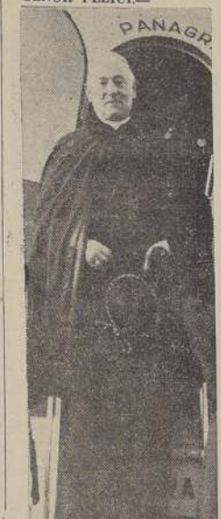
El Nuncio Apostólico.

Ayer se dirigió a Buenos Aires el Nuncio Apostólico EN "LOS CERRILLOS" SE TRIBUTO UNA CARINOSA DESPEDIDA AL EXCMO. SEÑOR FELICI.