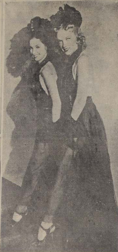
Angeles negro... Francois Mauriac nos perdonará si se nos viene este nombre a la mente al contemplar a estas hermosas muchachas "made in Hollywood"