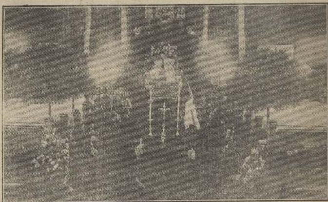
La capilla ardiente en la Hedwigskirche de Berlín.