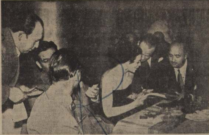
EN EL "WALDORF". — La estrella del cine mexicano MARIA FELIX, en los momentos en que recibe un obsequio de la Gerencia del Waldorf.