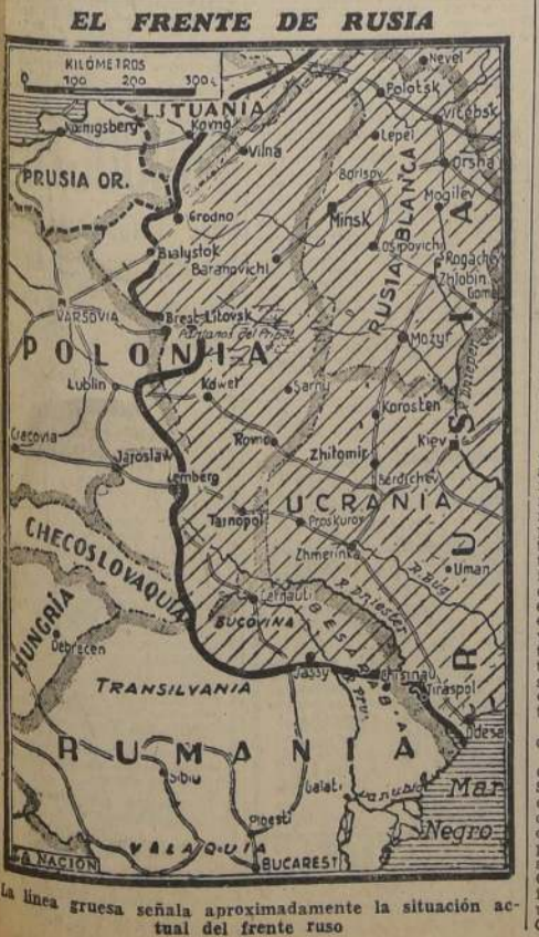
La línea gruesa señala aproximadamente la situación actual del frente ruso