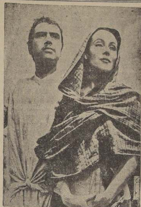
Dolores del Río y Pedro Armendáriz en una escena de la producción extraordinaria titulada "MARIA CANDELARIA", que la Soc. Cinematográfica Band y Salas presentará el Martes en el Teatro Santa Lucía. — Esta producción de sello Films Mundiales constituyó en México uno de los mayores éxitos del corriente año.