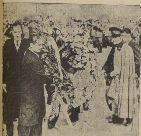
Colocando la corona en el monumento a O'Higgins