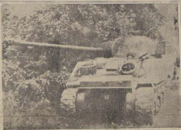
En las grandes batallas de tanques que se están librando en las llanuras del sudeste de Caen, los aliados emplean un cañón que lanza proyectiles de 17 libras, montado en un tanque Sherman, uno de los cuales podemos ver en esta telefoto