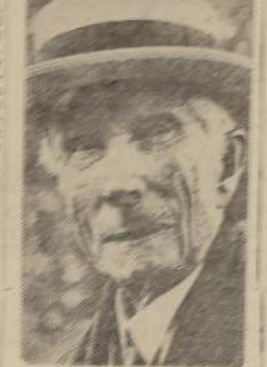
John D. Rockefeller