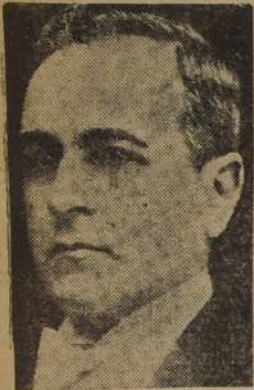
Excmo. señor Getulio Vargas, Presidente del Brasil, nación que hoy celebra el 123º aniversario de su independencia.