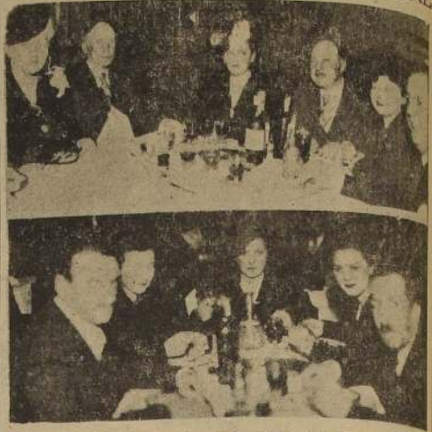
Families asistentes al dinner-dansant del miércoles último con que se animan semanalmente las agradables reuniones en la prestigiosa institución social de la calle Catedral.