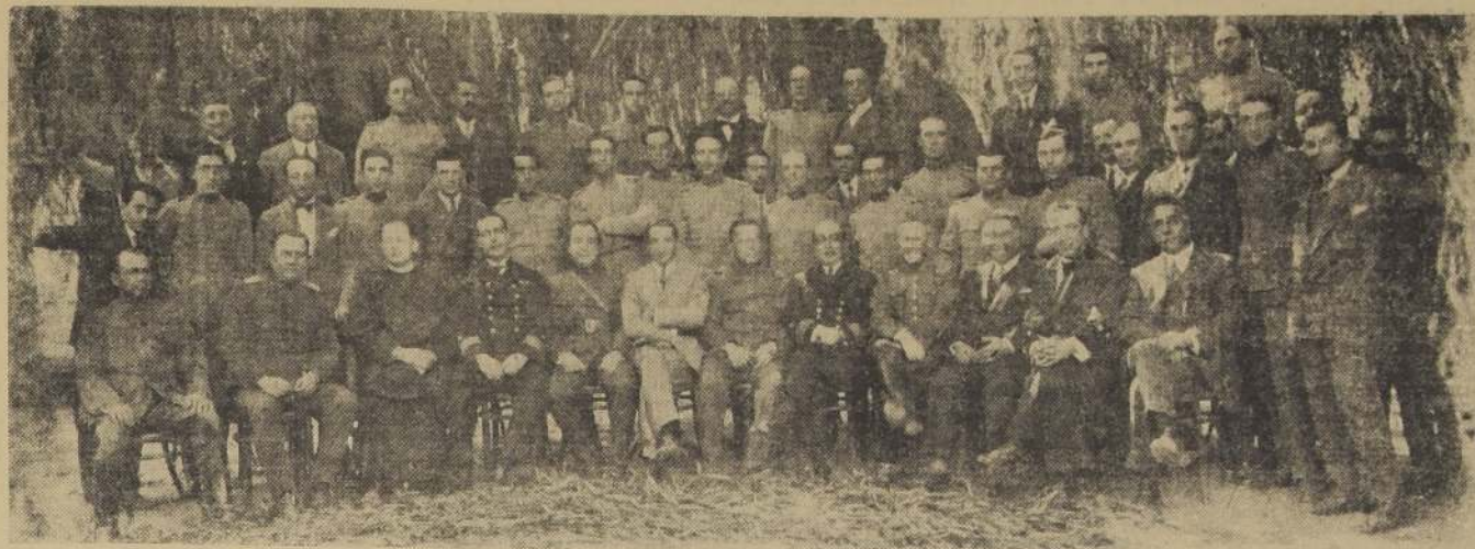
Los invitados a las fiestas de ayer en Maipo

EL 111.º ANIVERSARIO DE LA BATALLA DE MAIPO FUE CELEBRADO CON DIVERSOS ACTOS EN SANTIAGO Y EN MAIPU.—CON ESTE MOTIVO SE EXTERIORIZO ELOCUENTEMENTE EL ESPIRITU PATRIO