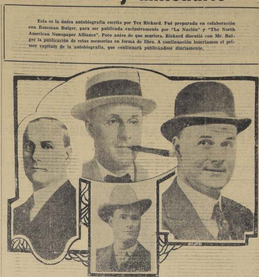
Tex Rickard, el famoso promotor que ofrece sus interesantes memorias a los lectores de "La Nación"