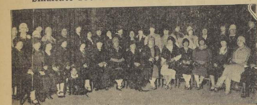
Grupo de socias asistentes al banquete con que esta institución conmemoró su 31.º aniversario.