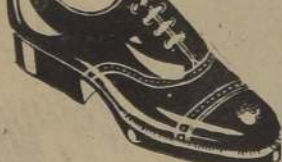
ZAPATON, en Gun Metal, Café y Negro; perforado, tipo americano.