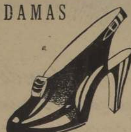
REINA, en Gun Metal o Gamuza, Charnán, café o Negro,