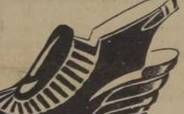
REINA, terraplán, plataforma tres pisos: Negro, Café y Beige