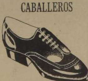
ZAPATON en Gun Metal, Café y Negro.