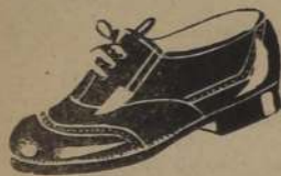
BONITO zapato, en doble suela, café y negro: