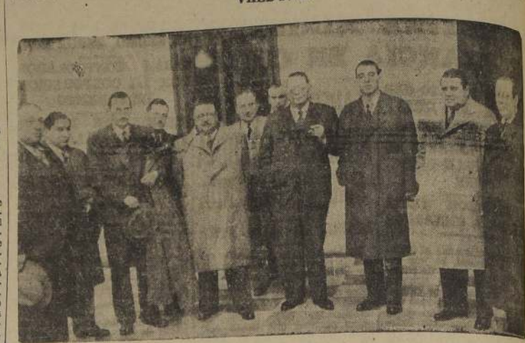
El Ministro señor Frei y vecinos de Valdivia en su visita al Laboratorio "Chile"

DIO A CONOCER EL GERENTE DEL LABORATORIO "CHILE" AL MINISTRO SEÑOR EDUARDO FREI Y A MIEMBROS DE LA SOCIEDAD AGRICOLA DE VALDIVIA