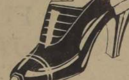
BONITA Reina, sin talón y sin punta, plataforma de corcho,