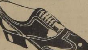
ZAPATON, doble suela, Gun Metal, Café y Negro,