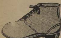
BOTITA, doble suela, café y negro: