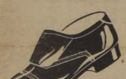
TIPO colegial, horma nipona, doble suela: