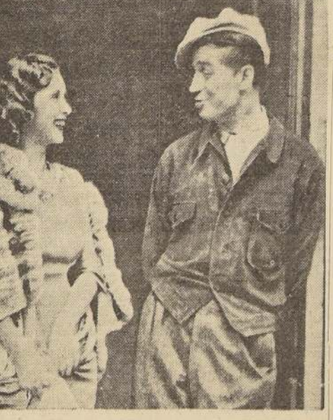
MAURICIO CHEVALIER, que en la película "Vagabundo del amor" ha tenido tanto éxito, acaba de terminar una nueva cinta intitulada "El hombre del día", en la cual, el celebrado actor francés, comparte su labor con Josette Day.

TEMA CONMOVEDOR TIENE LA CINTA "LOS PECADOS DE LOS HOMBRES"