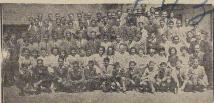
Este establecimiento, con motivo de la terminación del año escolar, reunió a los alumnos, profesores y padres de familia en una sesión de clausura del año escolar. Muy comentado entre los familiares de los alumnos fue el éxito de los exámenes obtenidos por sus educandos, pues del total del alumnado sólo fueron reprobados cuatro alumnos, entre Preparatorias y Humanidades. En la presente fotografía aparece un grupo de alumnos después de la reunión en referencia.