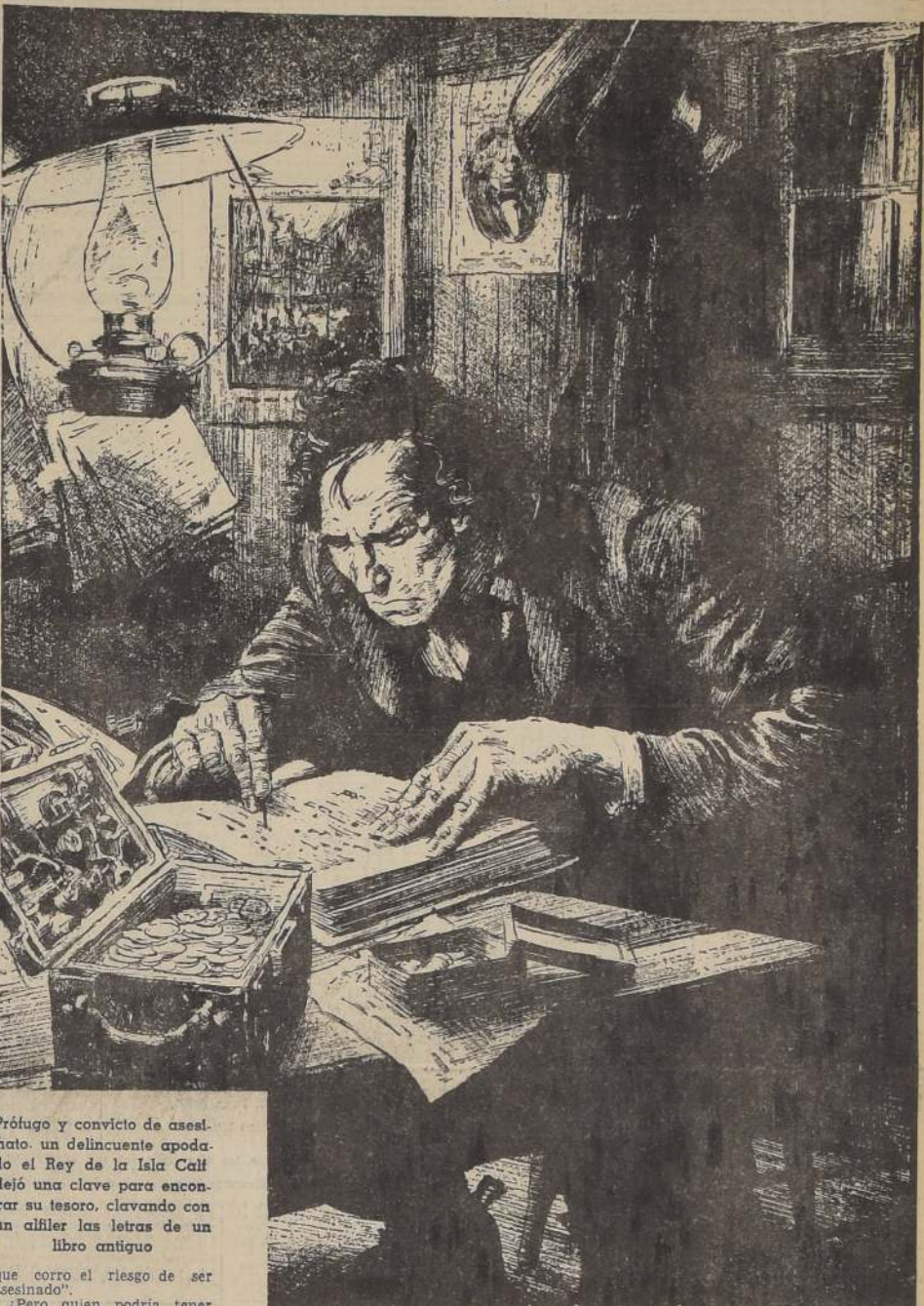
Prófugo y convicto de asesinato, un delincuente apodado el Rey de la Isla Calif dejó una clave para encontrar su tesoro, clavando con un alfiler las letras de un libro antiguo