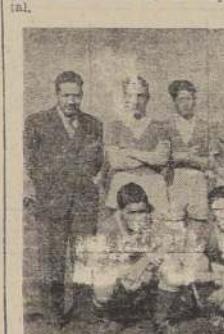
Equipo de fútbol, que compitió en la serie intermedia en la Asociación Escolar de Deportes, contra los distintos liceos de la capital.

Horario de Clases: De 8.30 a 12 M., y de 1.30 a 17 horas. La matrícula está abierta de 10 a 12 y de 5 a 7 P. M. Las clases empezarán el 14 de marzo. Los internos entran el 13 en la tarde. Servicio de micro a domicilio. Atención médica y dental. Los aspirantes a ingresar al Primer Año deberán someterse a un examen de admisión, que se tomará el 15 de marzo. SOLICITE PROPECTOS.