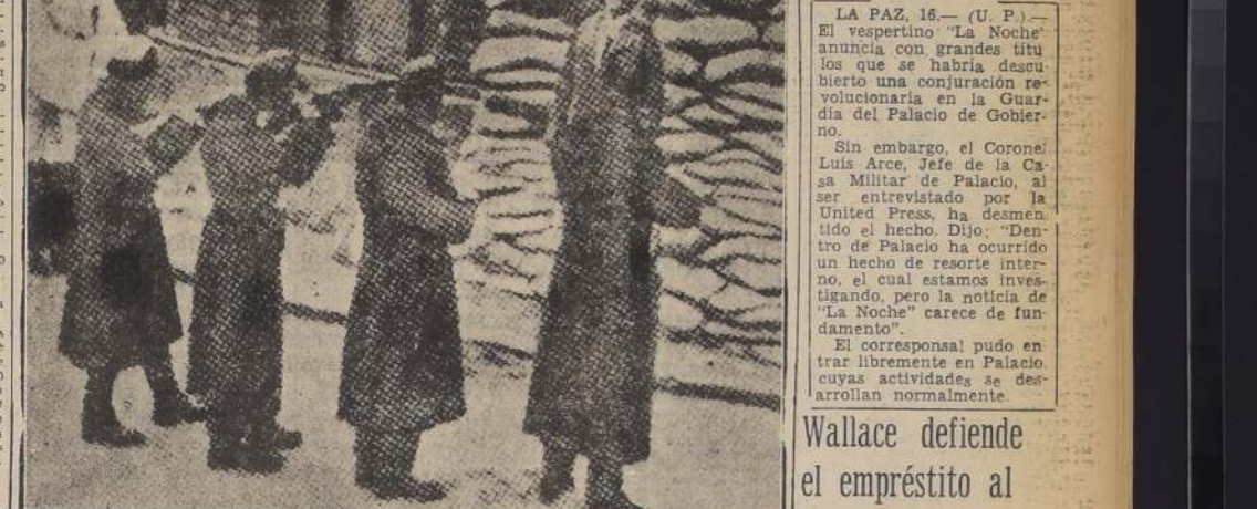
Ladislau de Bardoss, quien hizo entrar a Hungría a la guerra en favor de Alemania, es ejecutado por un pelotón de fusileros soviéticos después de un breve sumario.