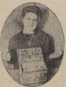
Había monedas de cuatro siglos y de una docena de países en el cofre localizado por el radar

Mr. Snow se complacía en decir que hay muy buena caza por delante para los modernos buscadores de tesoros.