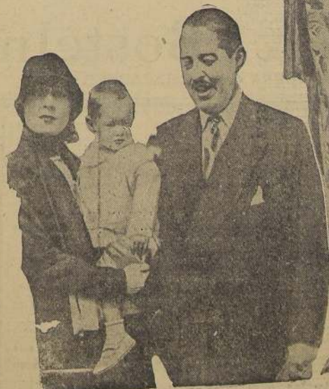
Reginald Vanderbilt en compañía de Gloria y de su hija, poco antes de su muerte