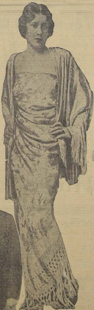
Una reciente fotografía de Thelma Morgan, tomada a raíz de su matrimonio con Lord Furness

de amor a primera vista. Aunque se encontraban frecuentemente en las fiestas, sus relaciones no lle-