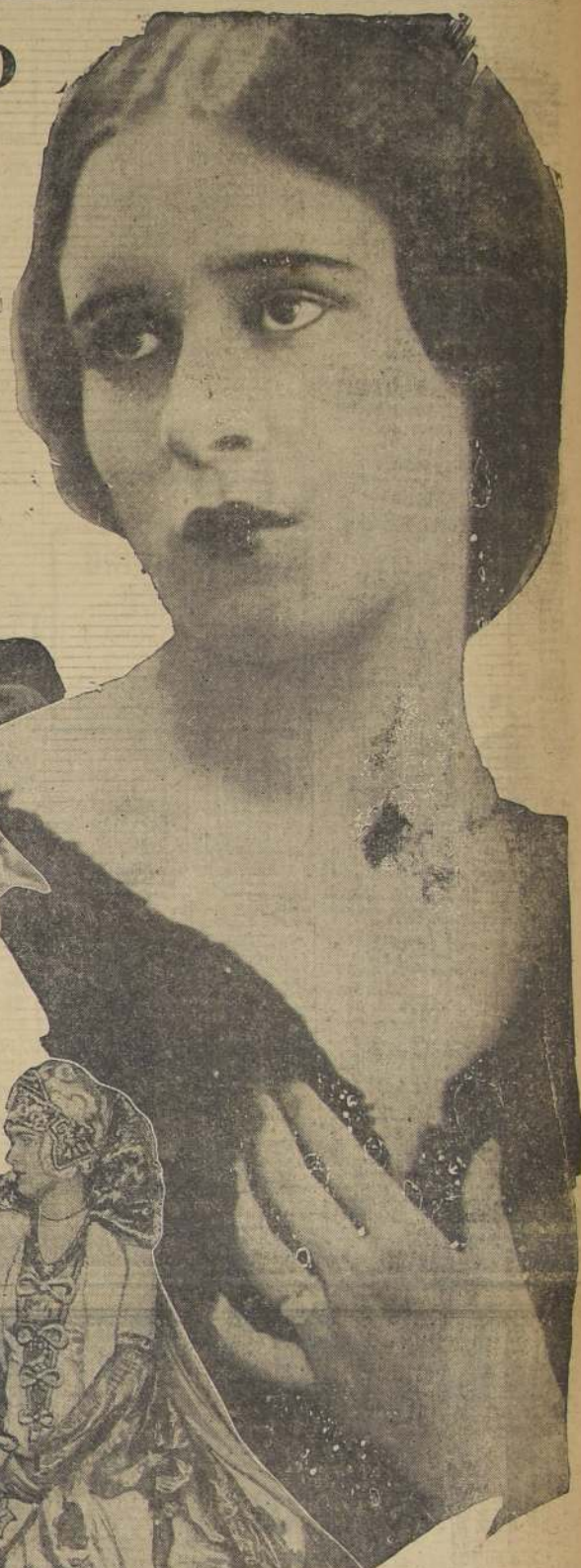
Gloria Morgan, la actual prometida del príncipe

La casualidad agregó combustible a la llama que comenzaba a arder entre ellos. Unas pocas semanas más tarde, el día que yo partía, Reggie llegó al muelle en el preciso momento en que el bar-