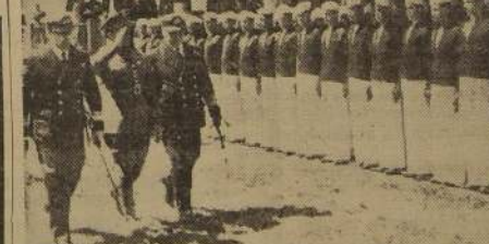
El Excmo. señor Betetta y el Comandante en Jefe de la Armada durante la revista de la Escuela Naval

desde antes de las 19 empezó a movilizarse en dirección a la Estación Central una enorme muchedumbre, que fué ocupando con apresuramiento todos los sitios libres de la Plaza Argentina. Al mismo tiempo, se empezó a notar en ese mismo sector un extraordinario movimiento de vehículos, que dejaban su carga de pasajeros y partían hacia todas las direcciones de la ciudad. Poco a poco, el público fué excediendo la capacidad de la Plaza Argentina en compactas filas por la Avenida Bernardo O'Higgins en dirección al Oriente. Una hora después, estas gruesas filas de público, en que formaban gentes de toda condición y edades, cubría toda la extensión de la Avenida O'Higgins, por la calzada Sur, hasta la Plaza Bulnes. Con este motivo, el tránsito de tranvías y otros vehículos hubo de ser desviado hacia calles adyacentes.