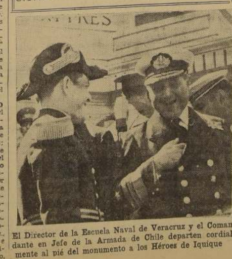
El Director de la Escuela Naval de Veracruz y el Comandante en Jefe de la Armada de Chile departen cordialmente al pie del monumento a los Héroes de Iquique