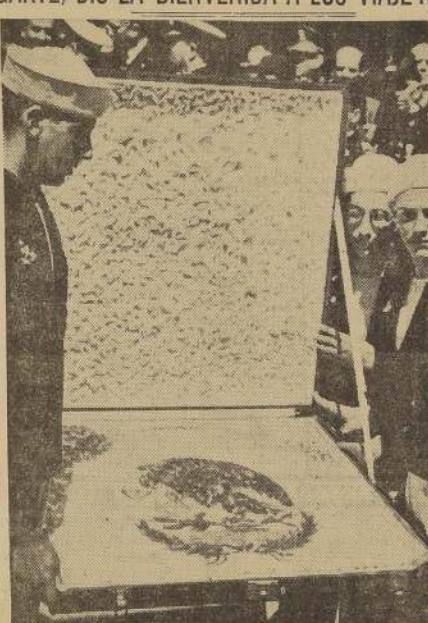
La bandera con los colores de la Escuela de Veracruz obsequiada al Director de la Escuela Naval de Chile

El Secretario de la Embajada de México trazó con magnífica elocuencia la personalidad, de Prá a quien los cadetes de la Escuela Naval de Veracruz ren-