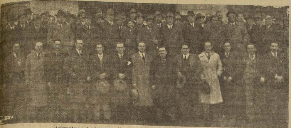
Asistentes a la inauguración de la planta seleccionadora de semillas