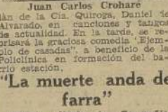
Juan Carlos Crohare

Brillantes caracteres prometen dominar el festival que en honor y beneficio del primer actor de la Compañía Camila Quiroga, se efectuará esta noche en el Teatro Municipal. Juan Carlos Crohare, es uno de los actores jóvenes de más real personalidad que haya visitado últimamente nuestros escenarios. La capacidad interpretativa de este joven artista es múltiple; gaitán sobrio, actor dramático, creador excelente de tipos que caracterizan notablemente; y de relieve bien definidos en el género festivo. Además, Crohare es un poeta de valía. Así están para demostrarlo su poema dedicado a Chile y la Argentina, y una serie de versos que el público chileno ha podido escuchar a través de las audiciones de radio ofrecidas por el actor argentino. Autor de numerosas comedias para teatro y para radio, Juan Carlos Crohare se ha ganado ya aquí y en Buenos Aires, un sólido prestigio. No hace mucho, la compañía de Lucila Durán estrenó una deliciosa comedia suya, "Tres hombres y una muchacha", de hermosa factura y que fuera recibida por la crítica y el público con singular agrado. Juan Carlos Crohare ha elegido para su función de honor la comedia en verso de Bellario Roldán, "El rosal de las ruinas". A esta "función", habrá un fin de fiesta a cargo del beneficiado que hará un recital poético y del musical.