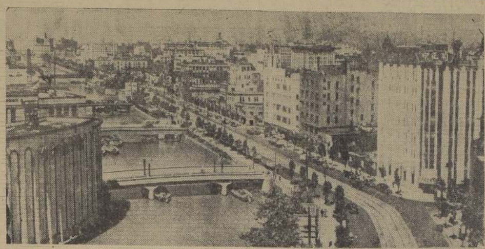
El barrio de Marunuchi, centro comercial de Tokio.

Se calcula que hay alrededor de 76.000 hogares inundados en 10 días de persistentes lluvias