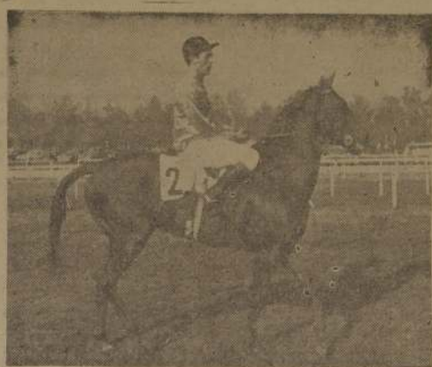
Como para desquitarse la última del Chile

Con buen número de anotados, se ofrecen atractivos para el apostador las competencias que corresponden a los handicaps intermedios del programa de pasado mañana domingo.