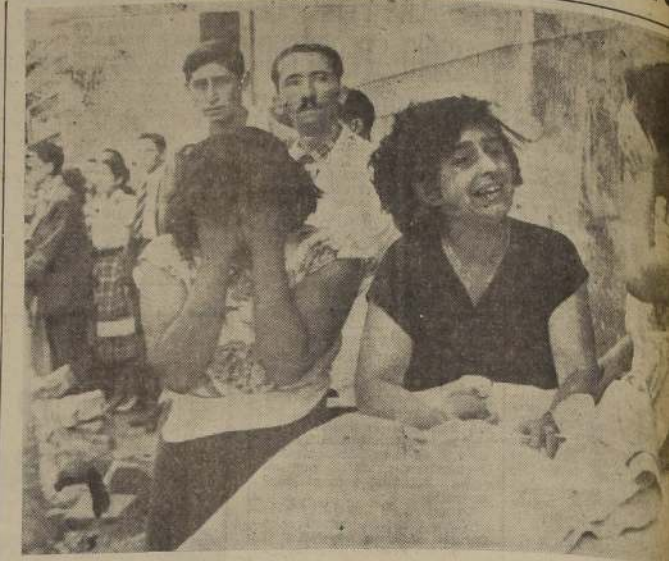
ESPOSA DE S. E. VISITO A LA POBLACION OBRERA DE MADECO