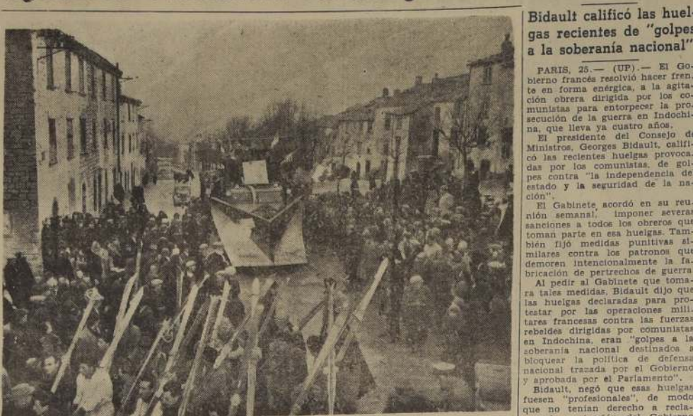
ALDEA DA LA BIENVENIDA A UNA BARREDORA DE NIEVE. — CAPRACOTTA (Italia). — Los habitantes de esta aldea dan una gran bienvenida a una nueva barredora de nieve que recibieron como obsequio de Jersey City. Esta aldea está situada en las montañas de los Apeninos. Frente a la barredora de nieve de 11 toneladas de peso, marchan los esquiadores de la aldea. Jersey City realizó una subscripción popular a raíz de que el Alcalde de Capracotta hizo un llamamiento para que le ayudaran a reemplazar la barredora de nieve que fue destruida por los nazis durante la ocupación alemana.