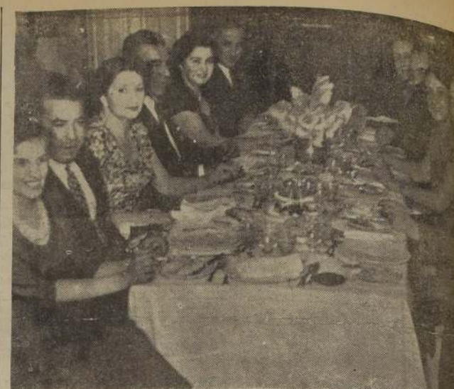
EN EL ORIENTE.—Comida ofrecida en los salones del Oriente por el Comandante Militar del Uruguay, a un grupo de sus relaciones.