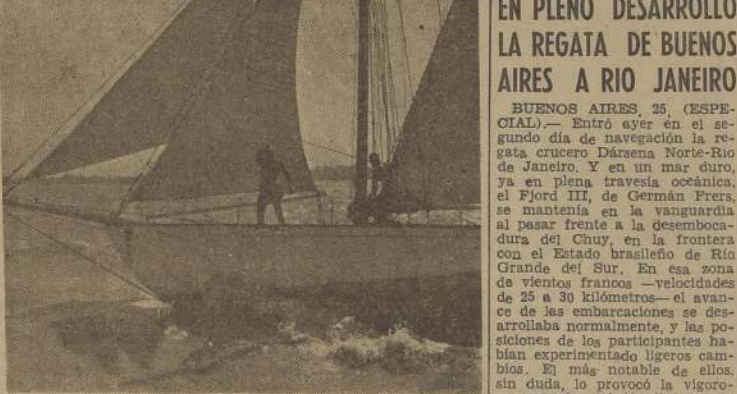
FIRME LA PROA!—Al iniciarse la regata de yates de crucero, entre Buenos Aires y Río de Janeiro, la brava del mar obliga a los tripulantes de esta embarcación a recurrir a su arte náutico. Así se aprende. Contrasta esto con lo que ocurre en nuestro país. La regata de crucero entre Valparaíso y Quintero, en celebración del Día del Mar, fue suspendida por brava de las aguas, en lugar de correrla para probar, así, los progresos náuticos de nuestros yachtmén. No hay que olvidarlo para otra vez...