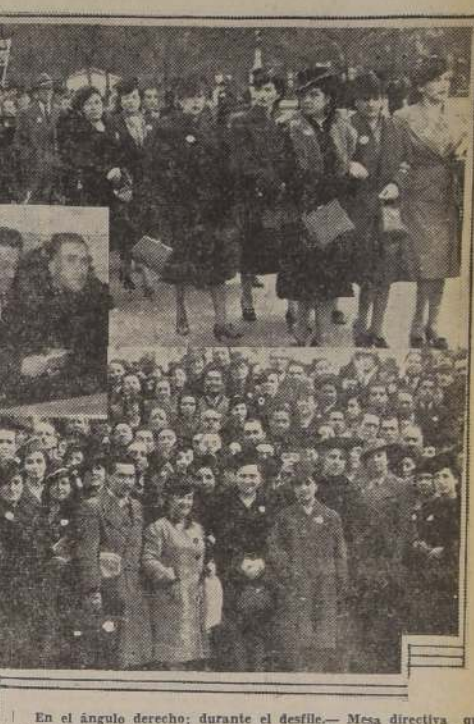
En el ángulo derecho; durante el desfile.— Mesa directiva que presidió la concentración en la Universidad.— Abajo: Delegaciones de San Felipe y Valparaíso que visitaron LA NACION

Próximo a clausurarse el actual período de sesiones ordinarias del Congreso, este desaliento se acentúa, justificadamente, por cuanto no existe la seguridad de que este proyecto sea