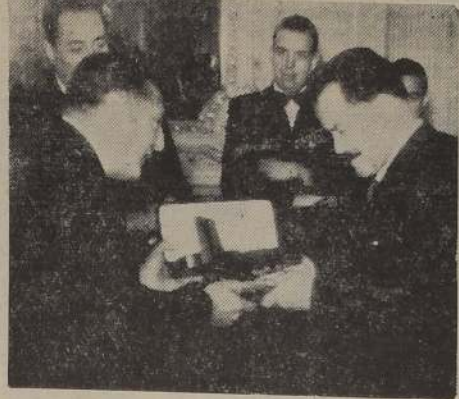
S. E. en el momento de recibir la condecoración del Gobierno de Guatemala.