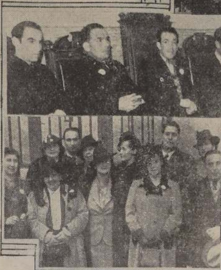
En el ángulo derecho; durante el desfile.— Mesa directiva que presidió la concentración en la Universidad.— Abajo: Delegaciones de San Felipe y Valparaíso que visitaron LA NACION

EL DESFILE A las 17 horas, el profesorado de Santiago y delegaciones, se concentraron en la Universidad de Chile, para oír la palabra de varios de sus dirigentes. En seguida se organizó un gran desfile, encabezado por la delegación de Valparaíso, que portaba una bandera nacional. La continuación seguían grupos de maestros de las diversas comunas cercanas de Santiago. Esta gran demostración de fuer-