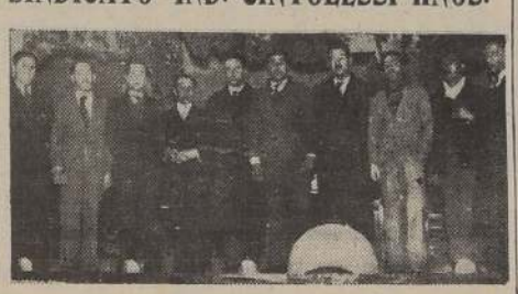
Dirigentes, miembros de comisiones e invitados del Sindicato Industrial Cintolessi Hnos., durante la reciente celebración del 12.º aniversario de la organización

ACTOS CULTURALES Y DE ARTE PARA SINDICATO DE PELUQUEROS Y COMITÉ PRO AHORRO POPULAR