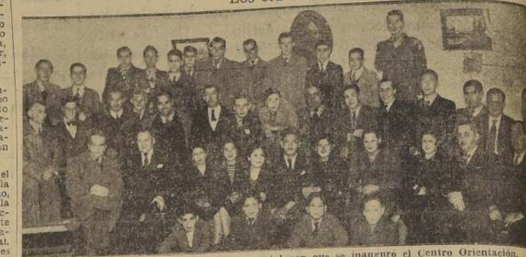
Asistentes a la reunión artística y social con que se inaugura el Centro Orientación.

Asistió al acto numerosa concurrencia de socios y sus familias. Los oradores